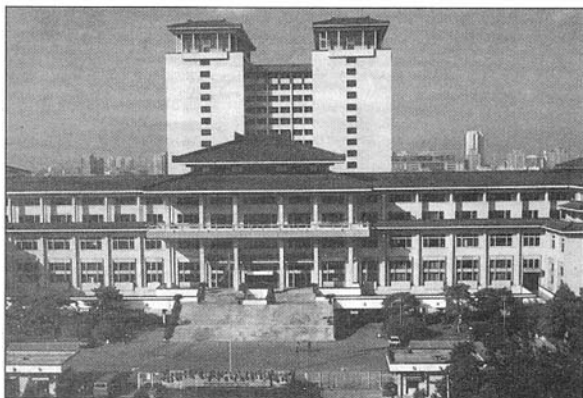
Нацыянальная бібліятэка Кітая ў Пекіне

У сталіцы Кітая, старожытным Пекіне (а першыя паселішчы з'явіліся тут каля 3000 гадоў таму назад), мы прабілі 3 з паловай дні. Горад уражвае арганічным спалучэннем даўніны і сучаснасці. У Пекіне захавалася мноства старожытных помнікаў: храмы, манастыры, пагоды, імператарскія паркі, мосты і палацы. Сучасны архітэктурны сілуэт — велічныя гмахі жылых і адміністрацыйных будынкаў, таніраванае шкло, бетон, адначасова