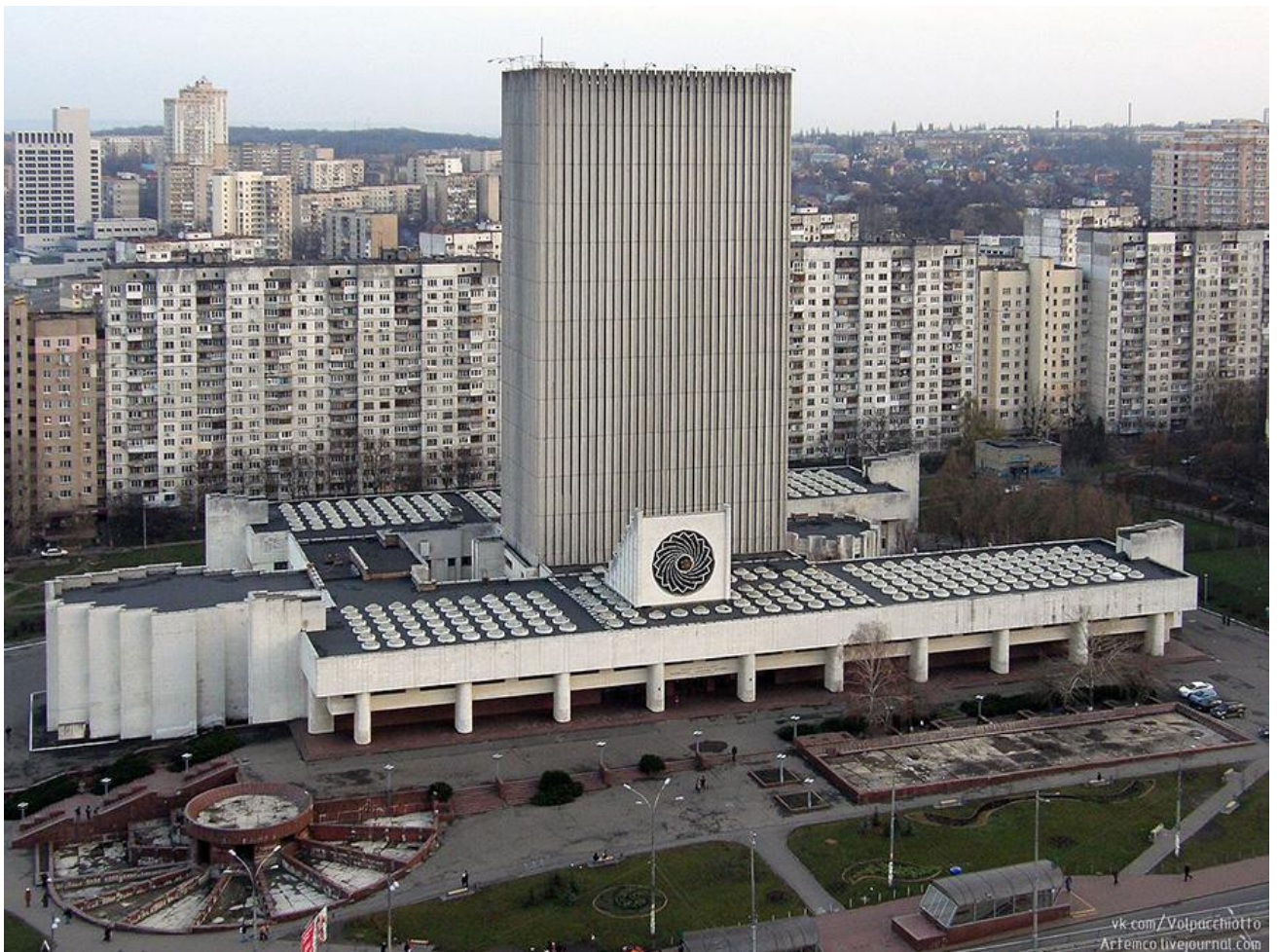
Киев. Национальная библиотека

«Мы ленивы и нелюбопытны...» — в конце жизни писал А.С.Пушкин. Вроде и не нас с вами имел в виду, но получается, что и про нас сказал. Поэтому могу лишь предложить: а давайте чаще оглядываться вокруг себя, больше видеть действительно хорошего, здорового, доказавшего ценность. И показывать это детям, и говорить им об этом, и сравнивать. Выездной урок в Национальной библиотеке — да с показом картинок, да чтобы от Киева и Львова до Нью-Йорка и Вашингтона, да со сравнительным анализом и рассказом о перспективах — разве это был бы не урок патриотического воспитания?