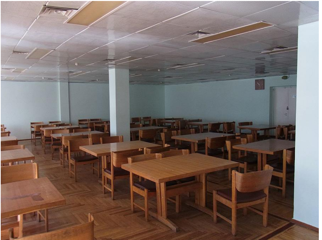
Киев. Национальная библиотека