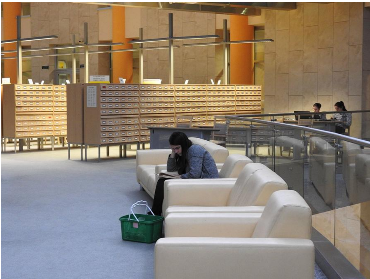
Минск. Национальная библиотека

Так это пані Оксана еще не все знает, подключились к обсуждению и белорусы: «Собрание пластинок, дистанционный электронный каталог, да вы в театрах не были». Вторят и украинцы, побывавшие в Минске: «А еще к библиотеке приезжают молодожены на фотосессию, вечером на алмазных гранях — реклама, и библиотека зарабатывает неплохие деньги». Восторги, конечно, приятны до смущения, но я спрошу: а вот вы, дорогие читатели, разве не знали обо всем об этом? Гордились? Или, как и я сам, «смирились с хорошим», даже несмотря на живые рассказы побывавших там друзей?