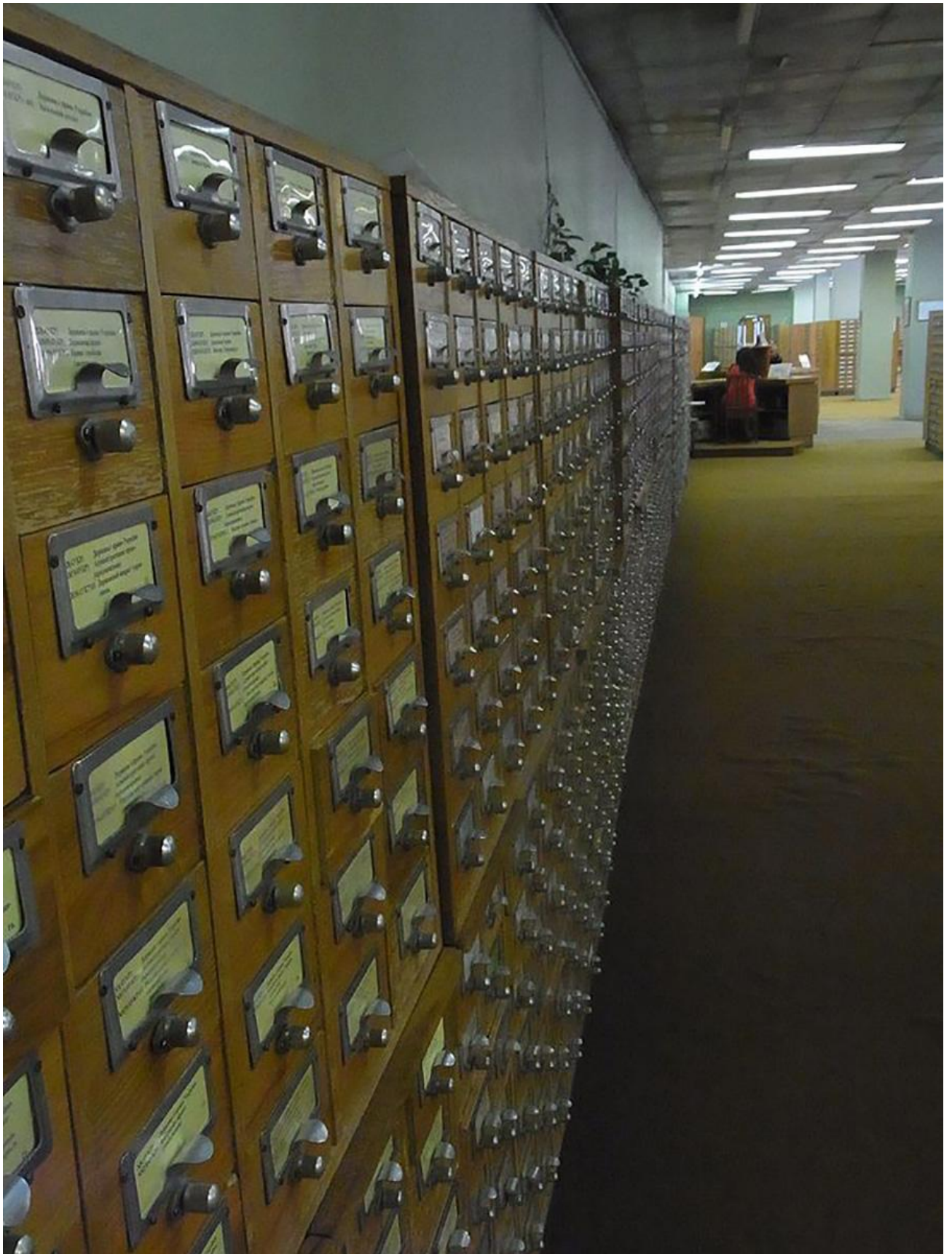
Киев. Национальная библиотека