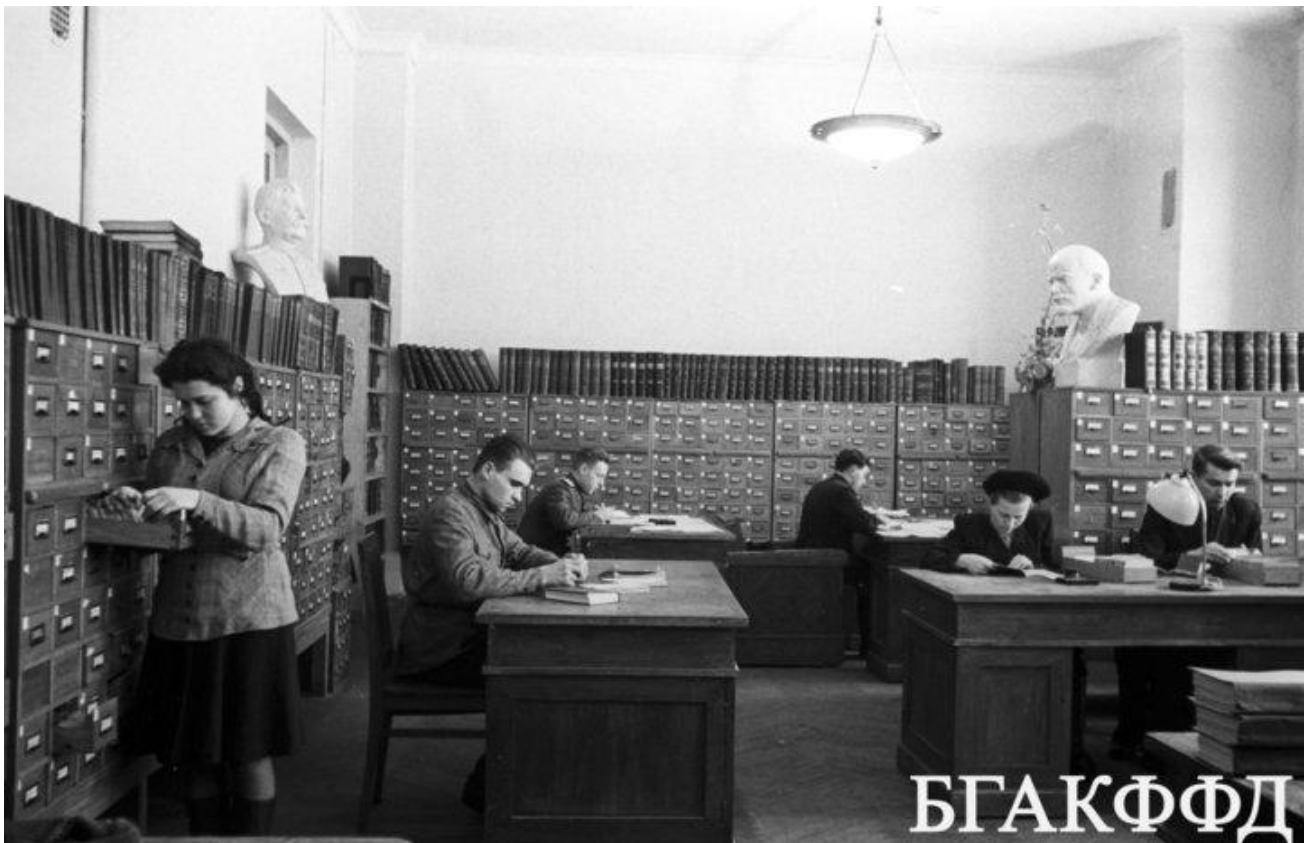
Статистический каталог библиотеки имени Ленина. 16 февраля 1948 года.