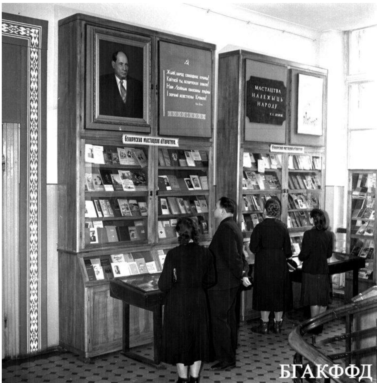
Посетители на выставке белорусской литературы в Государственной библиотеке БССР имени Ленина. 10 января 1962 года.