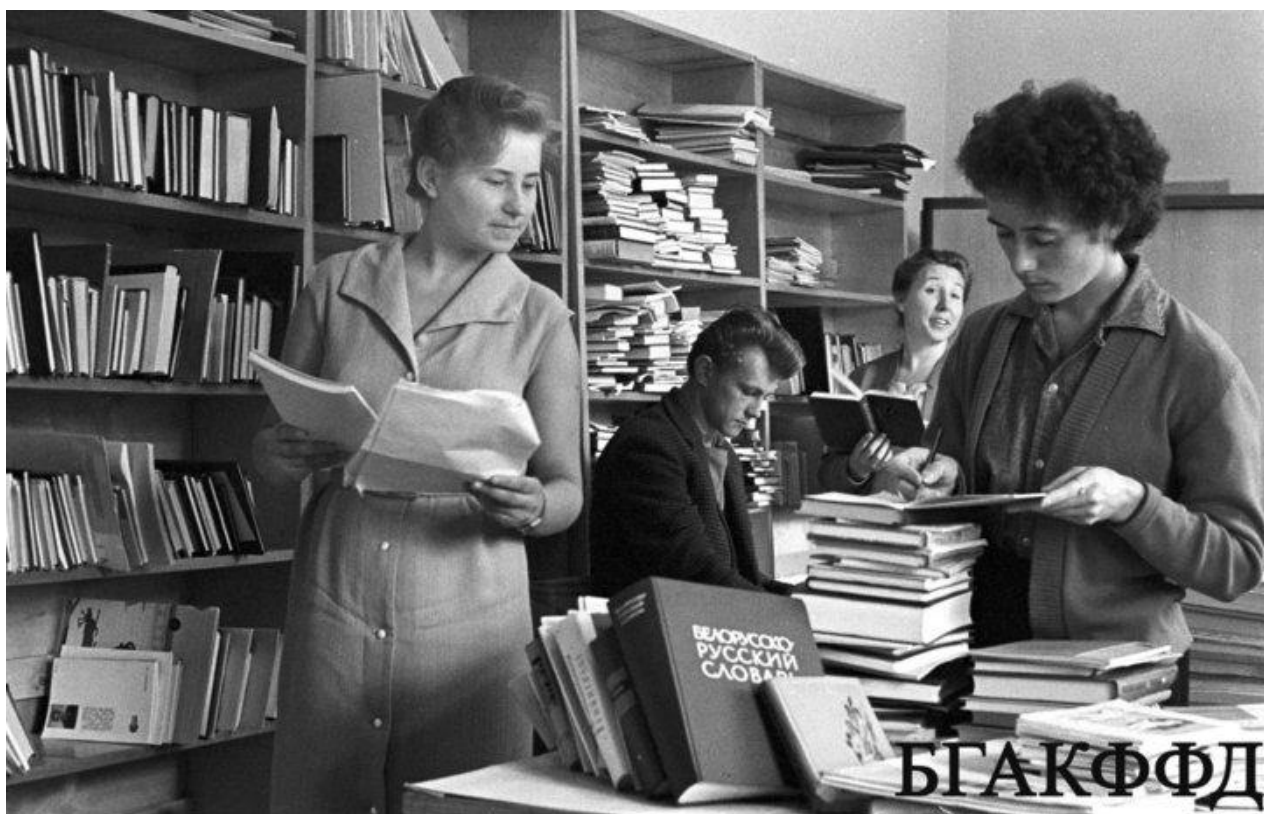
В отделе комплектования Государственной библиотеки БССР имени Ленина. 19 сентября 1962 года.