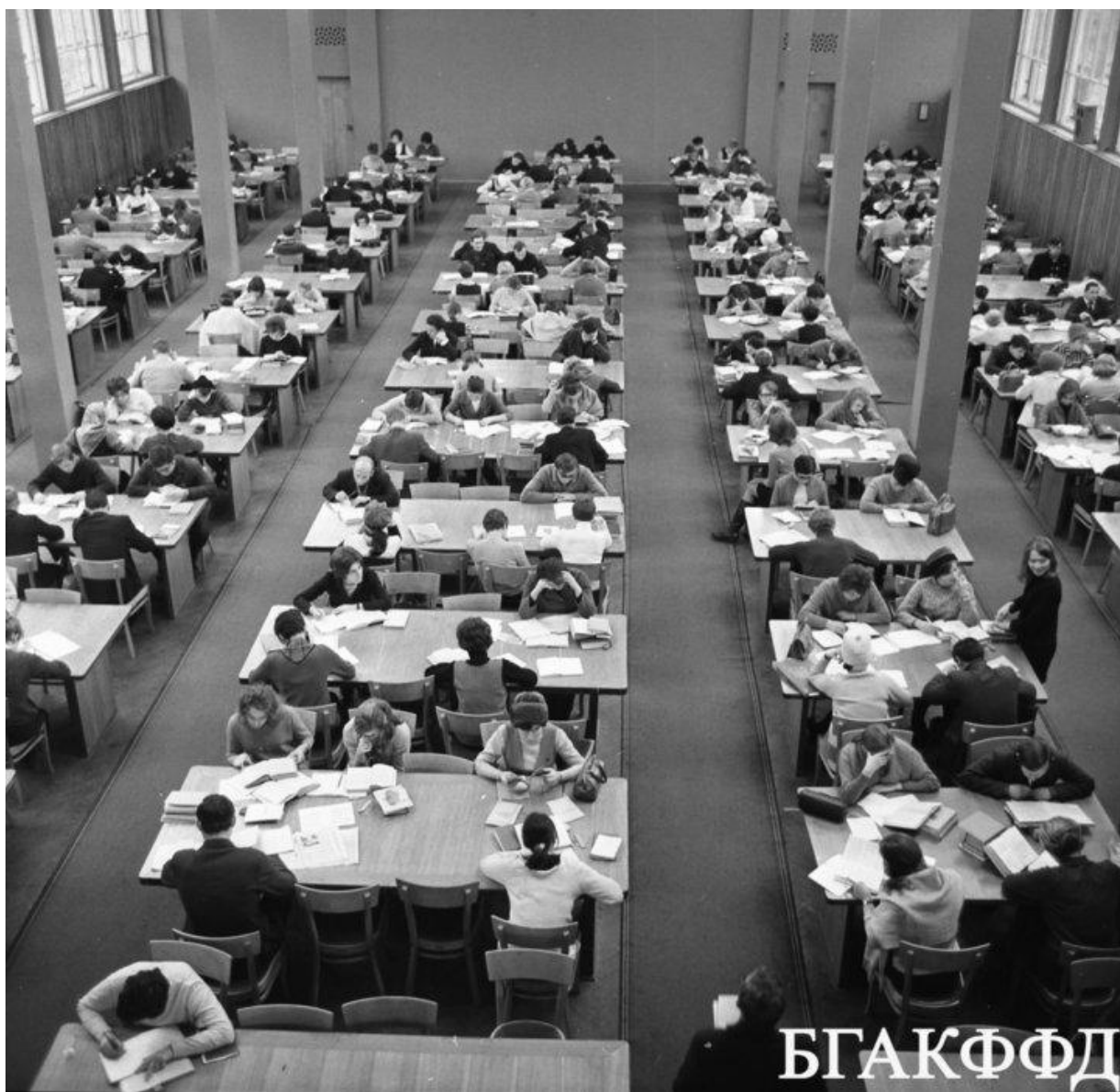
В общем читальном зале на 500 мест Государственной библиотеки БССР имени Ленина. Ноябрь 1970 года.