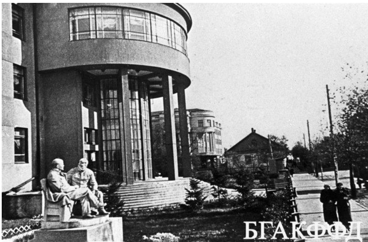
Вид на здание Государственной библиотеки БССР имени Ленина в Минске. 1939 год.

95 лет назад, 15 сентября 1922 года, постановлением правительства республики была основана Белорусская государственная и университетская библиотека. Позднее она поменяла статус (ее вывели из системы БГУ) и название (известна в народе как «Ленинка», теперь как «Националка»). Как выглядела библиотека в 1940—1980-е годы и как одевались ее посетители — в фотоподборке из Белорусского государственного архива кинофотофонодокументов.