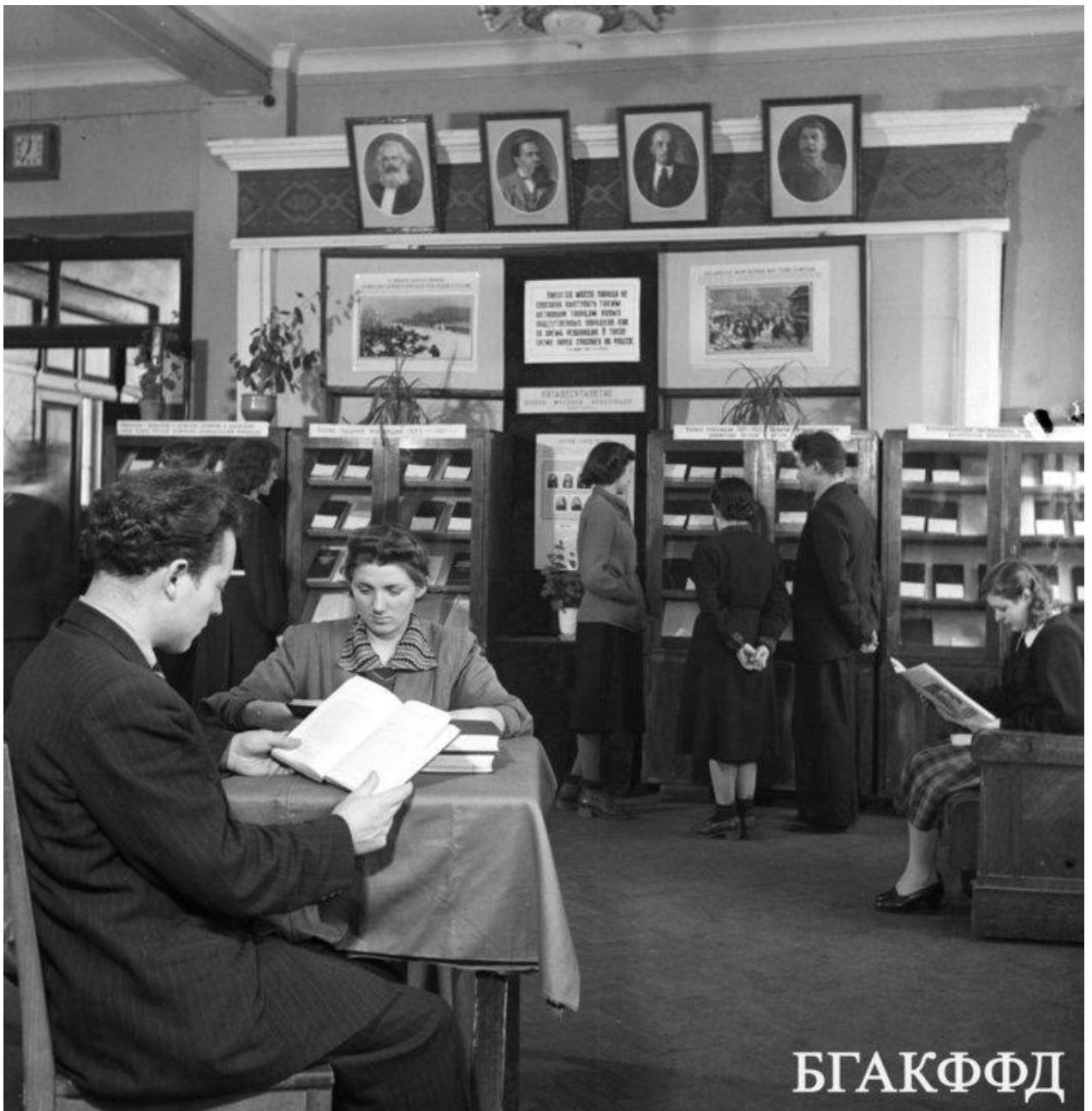
В Государственной библиотеке БССР имени Ленина. 10 февраля 1955 года.