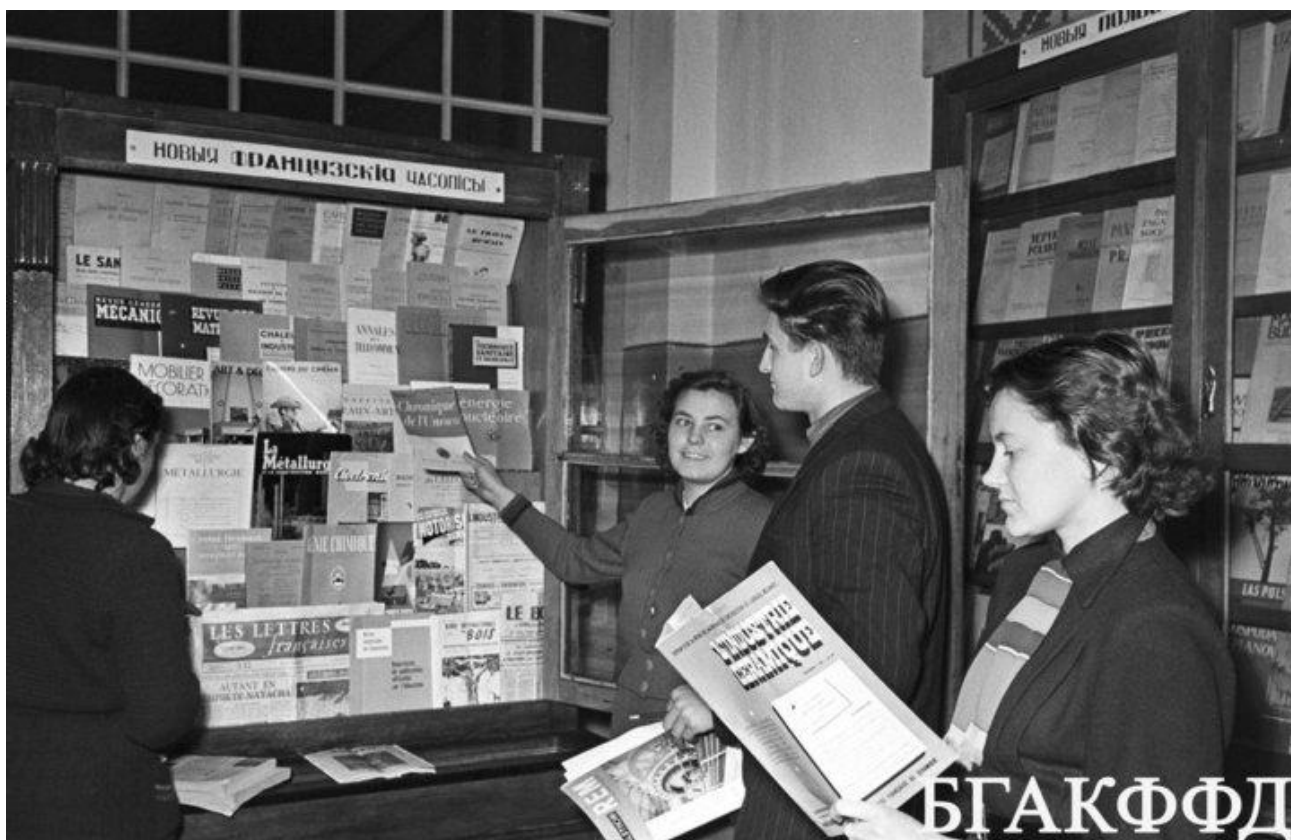
Посетители у выставки французских изданий в Государственной библиотеке БССР имени Ленина. 30 января 1957 года.