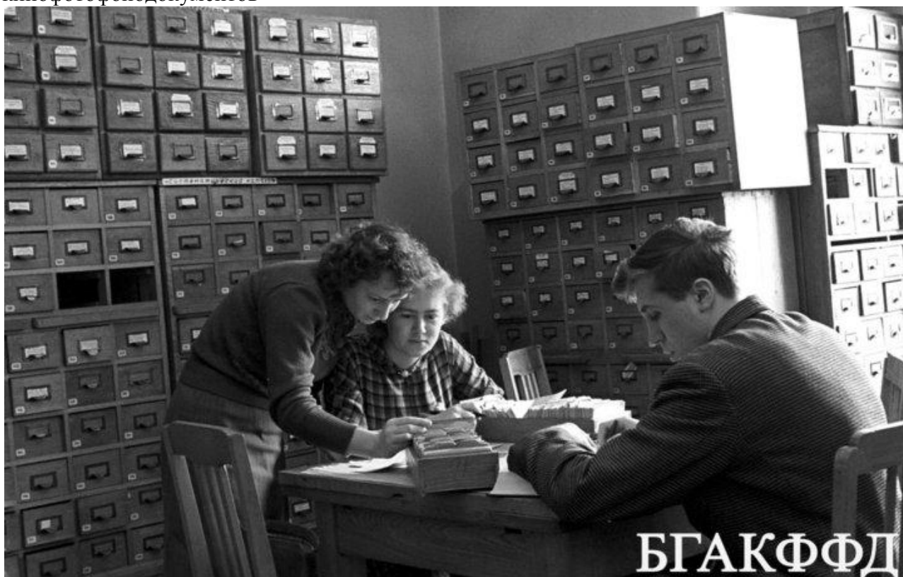
В исследовательско-библиографическом отделе библиотеки имени Ленина. 10 апреля 1960 года.