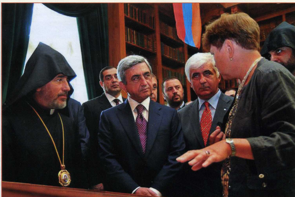
Президент Армении С.А. Саргсян (в центре) на открытии выставки «Памятники армянской культуры в РНБ» (2010)

В 2015 г., когда в России отмечался Год литературы, в дни проведения 43-й сессии МПА Российская национальная библиотека организовала в Таврическом дворце стендовую выставку «Литература, сближающая народы», рассказывающую о выдающихся литературных произведениях стран СНГ, авторах, чьи произведения стали частью мирового культурного наследия и фондов национальных библиотек СНГ. Выставку осмотрели главы парламентов государств Содружества и дали ей высокую оценку.