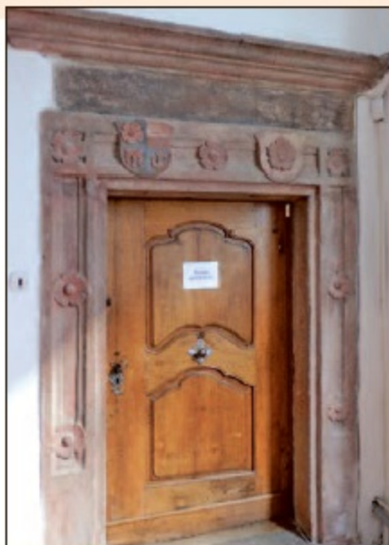
Входная дверь в областной исторический архив, где были найдены документы.

эти открытия очень ценные. Потому что это — прямые документы. Не ссылки в книгах архивистов и историков, а реальные документы, за которыми виден реальный человек. Таких документов во всем скориноведении, может, несколько десятков всего. Вот, скажем, за последние 200 лет разыскали несколько десятков документов, а мне удалось открыть четыре документа за две недели.