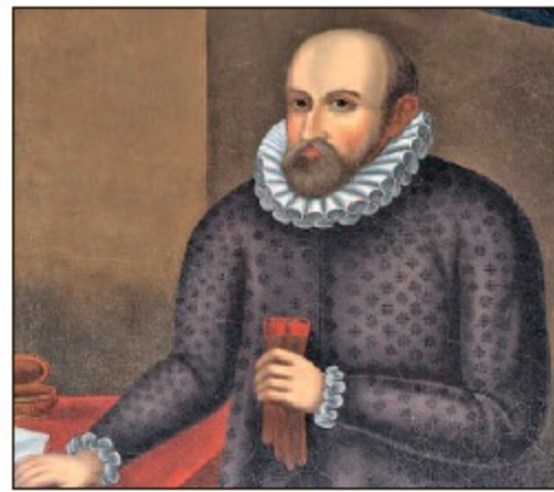
Судя по всему, Адам II из Градца был работодателем сына Скорины.