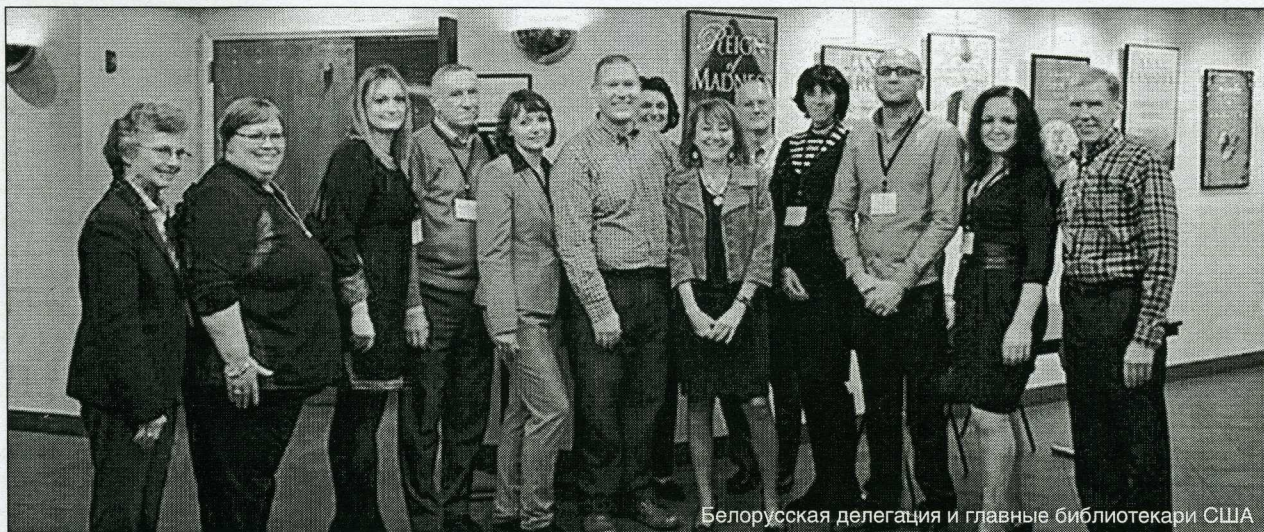
Белорусская делегация и главные библиотекари США

Например, чтобы построить Центральную библиотеку города Миннеаполиса – четырехэтажное стеклянное здание, занимающее площадь городского квартала, – 10 лет назад собрали референдум, на котором подняли вопрос об увеличении налога на недвижимость. Гражданами было принято положительное решение. И сейчас Миннеаполис гордится своей библиотекой.