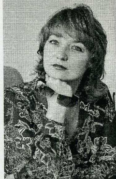
Заведующий отделом Национальной библиотеки Беларуси

В январе-феврале 2017 г. белорусская делегация специалистов в области библиотечного дела посетила Соединенные Штаты Америки. Визит был осуществлен в рамках программы Госдепартамента США «Американские библиотеки». За три недели пребывания состоялось тридцать пять профессиональных встреч в пяти штатах США: Джорджия, Вашингтон, Невада, Миннесота, Нью-Йорк. Мне посчастливилось быть в числе участников, и наиболее яркими впечатлениями я хотела бы поделиться с читателями «Бібліятэчнага света».