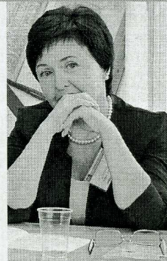
Председатель Совета ОО «ББА», первый заместитель директора Национальной библиотеки Беларуси

Главное в этом мире не то, где мы стоим, а то, в каком направлении движемся Оливер Уэндэлл Холмс