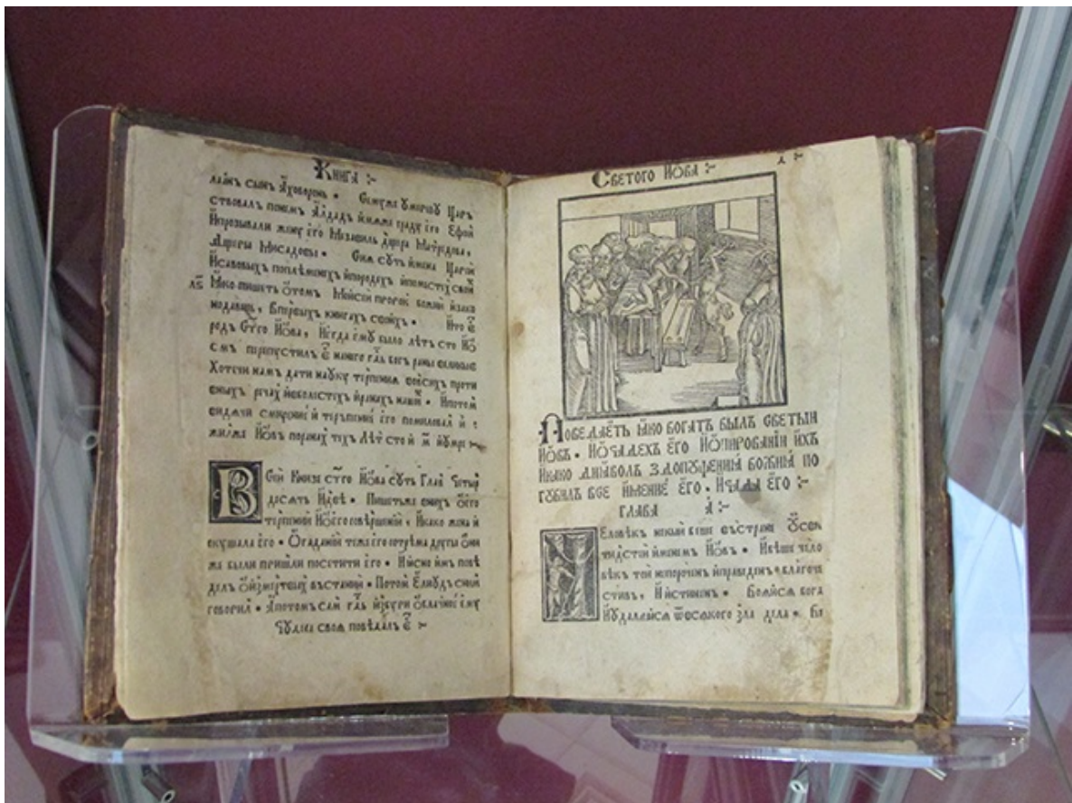
а также «Книга Иова» из собрания Национальной библиотеки.