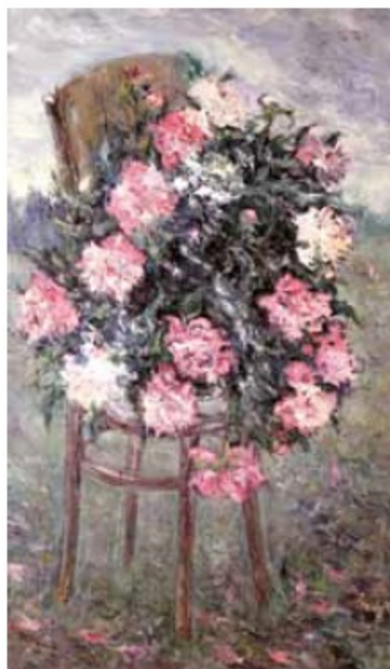
Выстава мастакоў у Нацыянальнай бібліятэцы — прыгожы дыялог дзвюх культур

настаўніка. Сімвалічна, што вось такая выстава прымеркавана да дня нараджэння Кабзара. Для тых, хто прыйшоў на вернісаж, яна стала сімвалам сяброўства двух народаў.