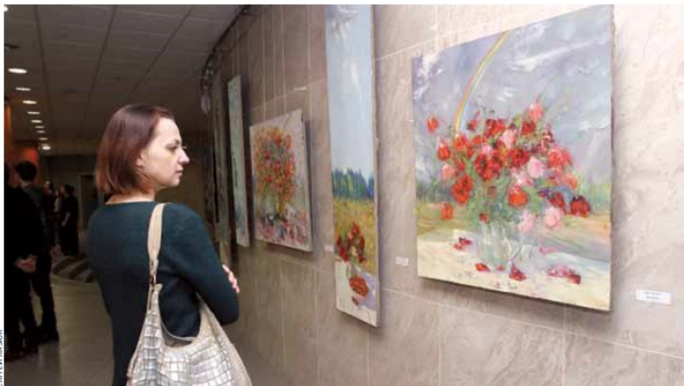
СВЯТЭЙ ЛА. ЗОК

На вернісажы было, скажам так, вельмі спрыяльнае гукава-візуальнае атачэнне, каб у думках перанесціся ў далёкае мінулае. На пачатку мінулага стагоддзя, сцвярджаюць даследчыкі літаратуры, Тарас Шаўчэнка істотна паўплываў на развіццё беларускай літаратуры. Для яго наша зямля не была чужой ды незнаёмай: праз Беларусь ён некалькі разоў праязджаў. Свае дарожныя назіранні выкарыстаў у апавесці "Мужыкі". А Янка Купала, Якуб Колас, Максім Багдановіч лічылі Кабзара сваім духоўным бацькам. Пэўна, і вучні Фёдара Свісцільніка, у тым ліку і Аляксандр Акуціёнак, з вялікай павагай ставяцца да