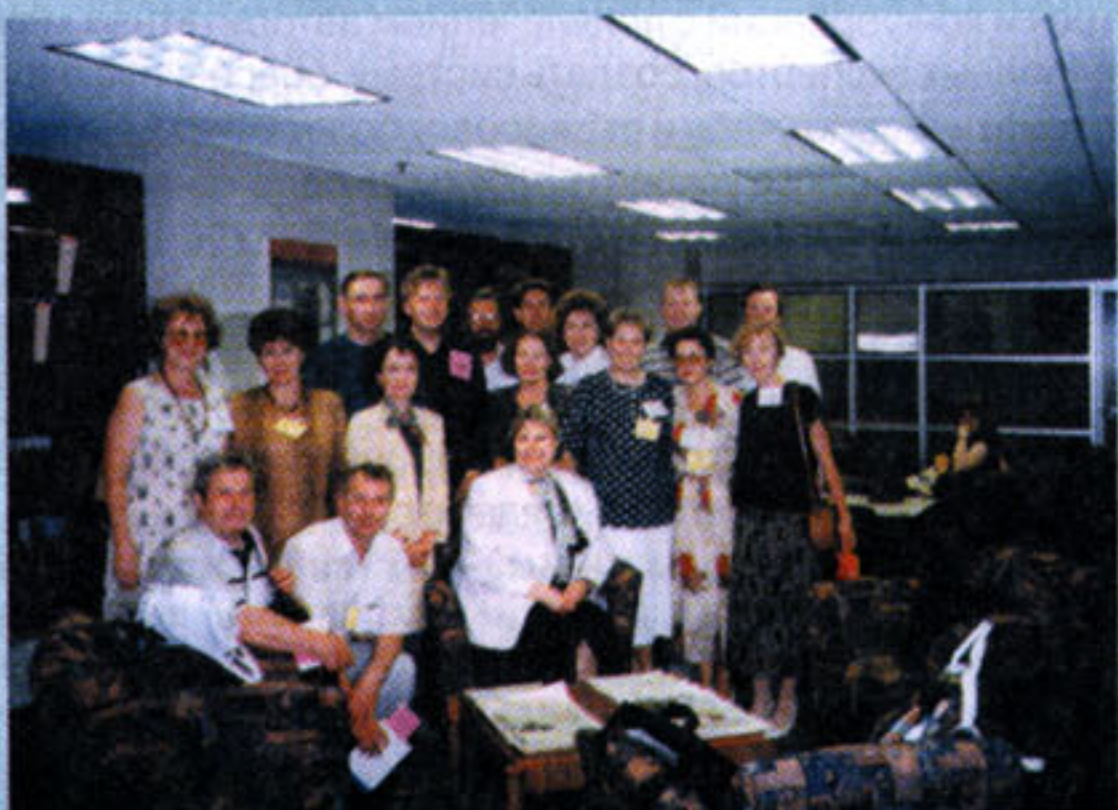
В Библиотеке МСІ во время визита белорусских специалистов в США.

С 1993 г. Европейское региональное бюро ВОЗ утвердило РНМБ в качестве Центра документации ВОЗ на территории Беларуси, что дало возможность библиотеке получать полный комплект изданий ВОЗ.