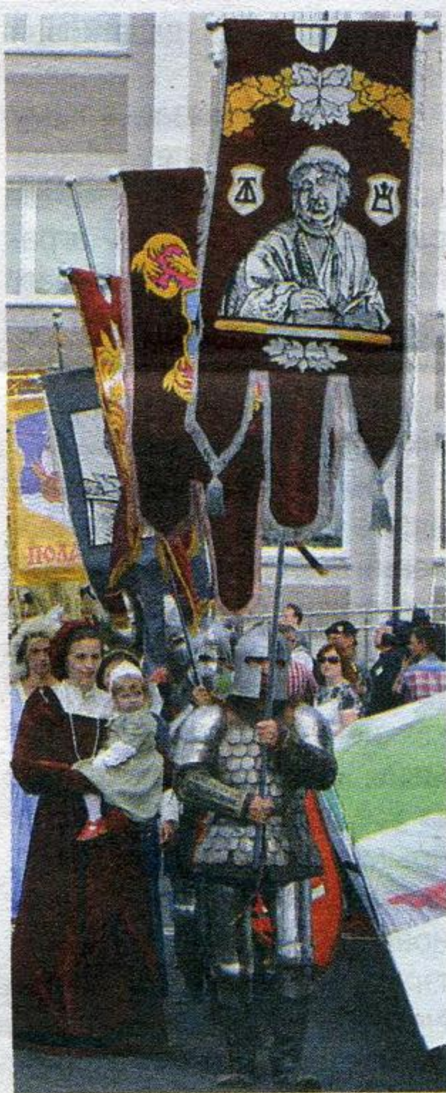
З гэтага эпізоду пачалося ўрачыстае шэсце падчас Дня беларускага пісьменства.

Пасля ўручэння прэмій і заканчэння святочнага прадстаўлення ад найлепшых эстрадных ансамбляў і выканаўцаў Беларусі — "Песняроў", "Харошак", Анатоля Ярмоленкі і многіх іншых — адбылася ўрачы-