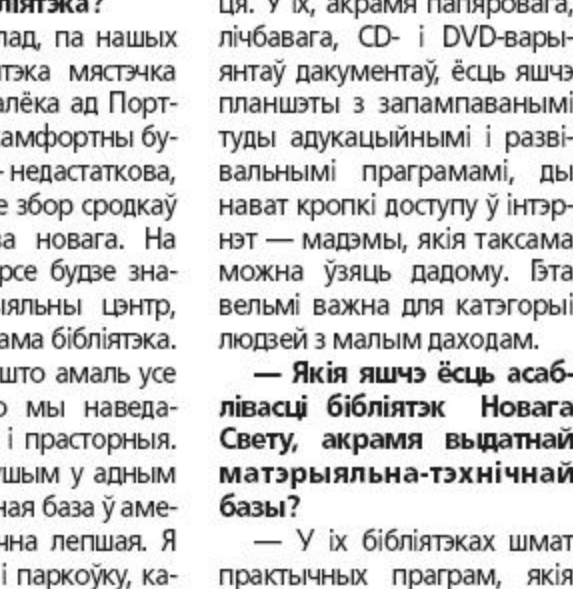
Публічная бібліятэка акругі Куінс.

спрыяюць адаптацыі людзей у грамадстве. У Амерыцы шмат эмігрантаў і бежанцаў, якія ўвогуле не валодаюць англійскай мовай. Фактычна, бібліятэка бярэ на сябе місію дапамагчы людзям займець слоўніковы запас першай неабходнасці. Ёсць камп'ютарныя курсы. Пры бібліятэках створаны "джобс"-цэнтры для пошуку работы. У Бруклінскай бібліятэцы вядуцца скайп-канферэнцыі нават з турмамі. У бібліятэках вельмі запатрабаваны сацыяльны аспект, яны максімальна яго задавальняюць. Пры некаторых установах Нью-Ёрка ёсць цэнтры, якія выдаюць карту Нью-Ёрка, яна прадастаўляе пэўныя прывілеі, даброты. Бібліятэка медыцынскіх навук у Солт-Лэйк-Сіці па просьбе карыстальнікаў амаль уся перайшла ў онлайн-рэжым. Там створаны базы даных, якія цікавыя ў першую чаргу студэнтам і выкладчыкам: