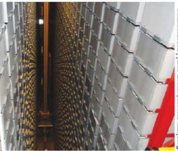
Сховішча высокай шчыльнасці і велатранжор у бібліятэцы медыцынскіх навук.