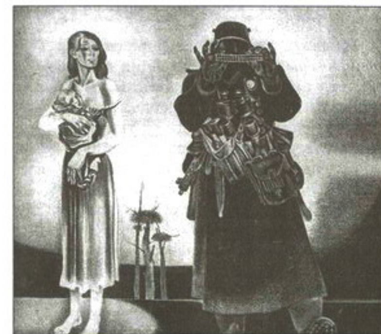
Калыханка. З цыкла «Час доўгіх нажоў». 1982

Персанальныя выстаўкі мастака праходзілі не толькі ў гарадах Беларусі, Украіны, Латвіі, але і ў Будапешце, Варшаве, Вене, Пітсбургу, Дэлі, Адыс-Абебе, Берліне, Дзюсельдарфе, Гамбургу, Маене і інш. Творы Г. Паплаўскага знаходзяцца ў Нацыянальным мастацкім