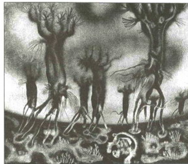
Пейзаж (Сон). З цыкла «Прагулкі з Ганешам». 1977—1979

тызму ўзаемаадносін прыроды і тэхнікі, адчуванне маштабнасці часу. Гэта тэма адлюстравана ў серыі літаграфій і афортаў «Высокае неба» (1974) і цыкле «Радзіма касманаўтаў» (1976—1978). Дrame чалавека, які імкнецца ў Сусвет, прысвечана карціна «Ноша. Зямное прыцягненне» (1992). Грандыёзнай і драматычнай тэмай у творчасці мастака стала трагедыя Чарнобыля. У літаграфіях «Дрэвы без лісця», «Дэактывацыя», «Рок-н-рол», «Бежанец» і іншых з графічнай серыі «Чарнобыль» (1987—1988) выразна выявілася творчая і грамадзянская пазіцыя мастака.