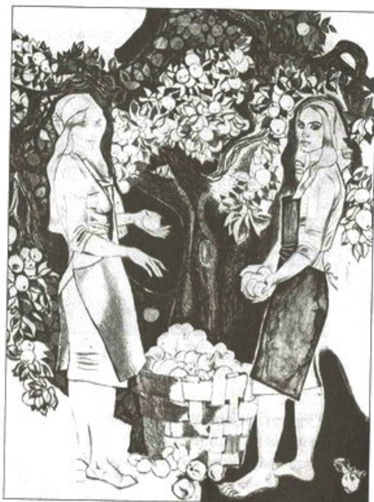
Ілюстрацыя да «Выбранага» Я. Коласа. 1982

музеі Беларусі, у выставачным аб'яднанні «Цэнтральны дом мастака», Музеі выяўленчага мастацтва імя А. Пушкіна