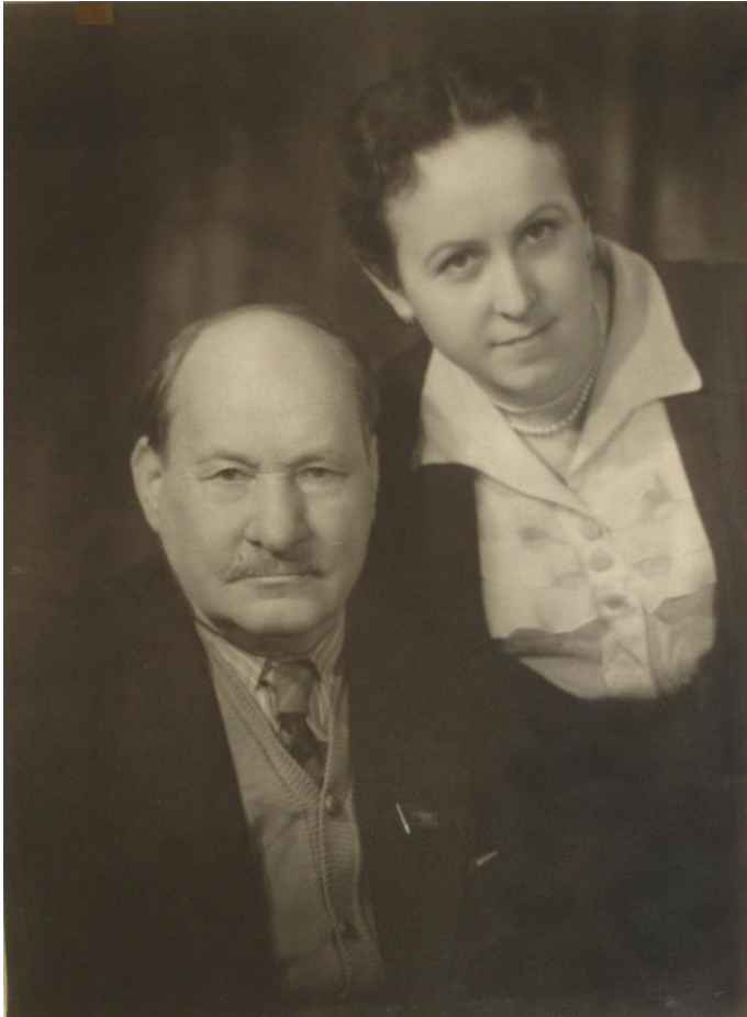
Якуб Колас с невесткой Натальей