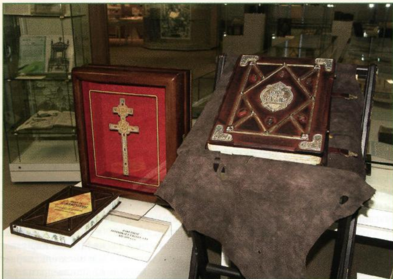
Выставка «Полоцкое Евангелие», 2014 г.

На выставке «Полоцкое Евангелие» (2014) не только демонстрировалось эксклюзивное воспроизведение одного из наиболее древних памятников книжной культуры Беларуси, но и предоставлялась возможность прикоснуться и полистать страницы уникального издания. Евангелие конца XII — начала XIII в. в течение многих столетий находилось в Полоцке. В первой половине XIX в. памятник был вывезен из Беларуси в Россию, где основная часть манускрипта хранится и сегодня. Совместными усилиями специалистов национальных библиотек Беларуси и России, Национальной академии наук Беларуси, Издательства Белорусского экзархата проведена реставрация оригинала, создана его качественная цифровая копия, подготовлено научное исследование особенностей рукописи и соб-