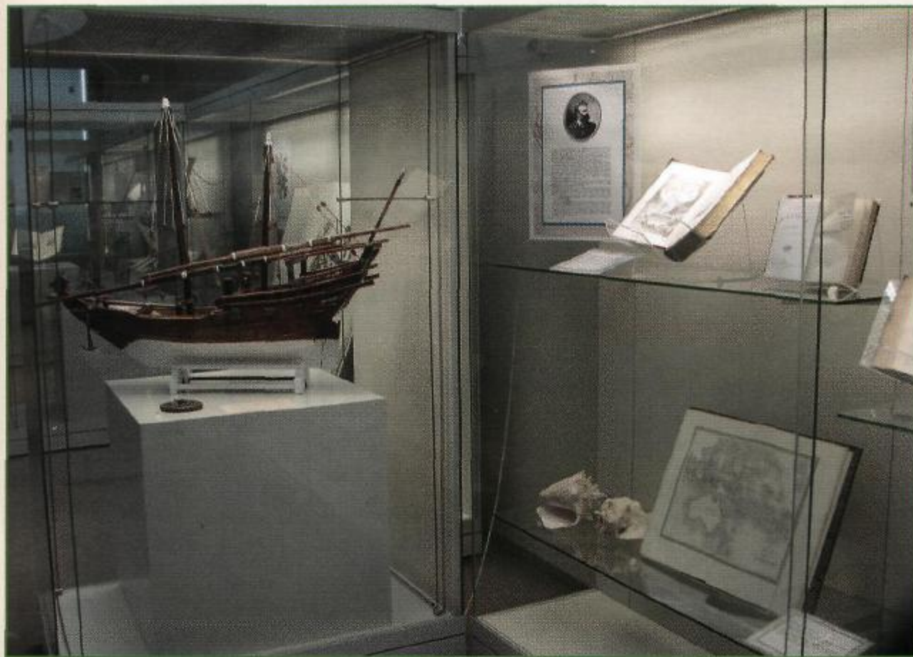
Выставка одной книги (Verne J. «Les Enfants du capitaine Grant. Voyage autour du Monde» 1868) к Международному дню музеев, 2013 г.

Главные герои романа путешествуют вокруг Земли по Южной Америке через Патагонию, по Австралии и Новой Зеландии, строго придерживаясь 37-й параллели южной широты, пытаются найти пропавшую экспедицию капитана Гарри Гранта. За время путешествия герои на своем собственном опыте испытали всевозможные опасности и приключения: шторм, сход лавины, наводнение, грозовые бури, извержение вулкана, встречу слюдоедами, кораблекрушение. Для создания атмосферы приключений и морских путешествий экспозиция включала картографические издания XVIII–XIX вв. с изображением континентов и островов, модель арабского парусника и большие морские ракушки.