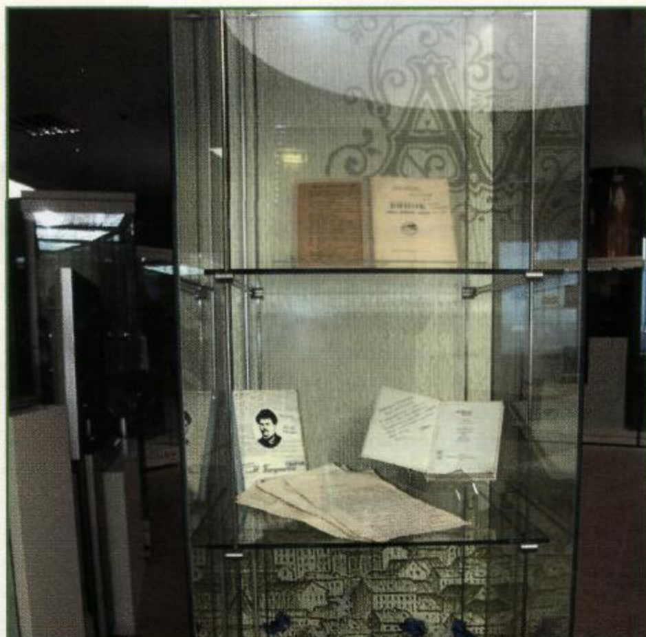
Выставка «Я не самотны, я кнігу маю...», 2011 г.

салон» в музее книги, где экспонировалась уникальная каллиграфическая книга с офортами петербургского художника Аполлинарии Мишиной. «Евангелие от Марка» — одно из четырех канонических Евангелий, которое считается самым ранним жизнеописанием Иисуса Христа и наиболее значительной книгой Нового Завета. Текст представлен в синодальном переводе, написан от руки, размещен параллельно на церковнославянском и русском языках и сопровождается иллюстрациями, созданными в технике цветного офорта. Рукописная книга целиком воссоздана полиграфическим способом издательством «Вита Нова» (Санкт-Петербург). Офорты иллюминированы сусальным золотом. Рукописная часть выполнена специально разработанным шрифтом на основе полуустава с сильным наклоном в левую сторону и длинными выносными элементами. В музее выставлялся номерной экземпляр № 2 и отдельные листы с оригинальным рукописным текстом и авторскими иллюстрациями.