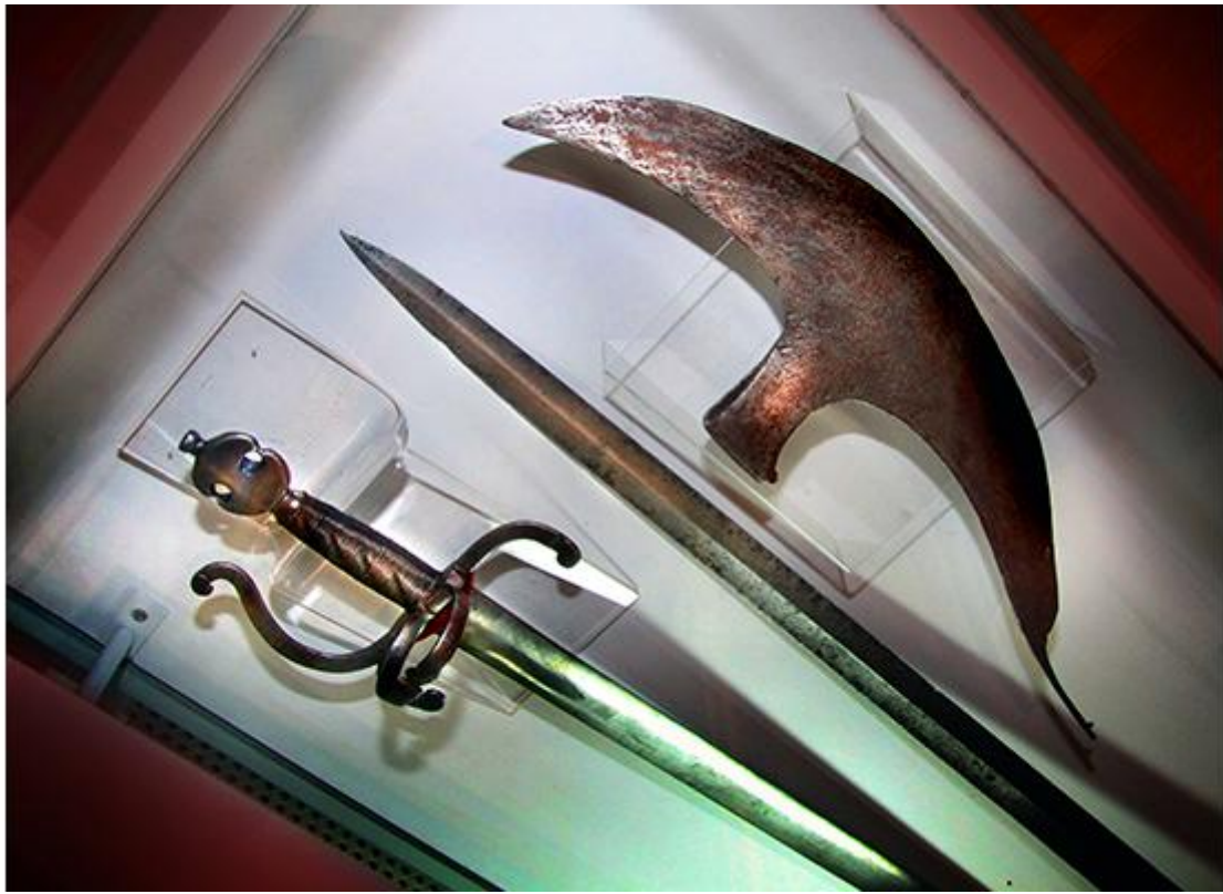
Зброя, яка служыла магнатам і іх сучаснікам.