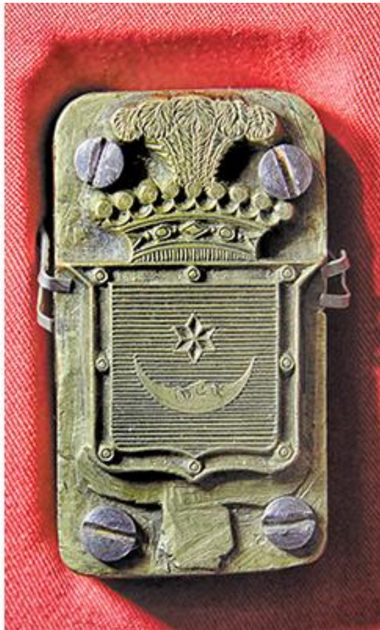
Пячатка з гербам «Ляліва» — узор майстэрскага ліцця і гравіроўкі.