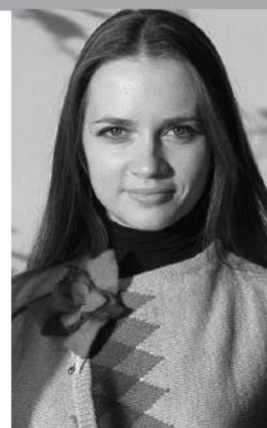
Главный библиотекарь Национальной библиотеки Беларуси

Древнегреческий философ сказал когда-то: «Чем больше я узнаю, тем больше понимаю, что ничего не знаю...». Сегодня не обязательно быть философом, чтобы понимать: знание, особенно в профессиональной отрасли, не статично, и для того, чтобы стать настоящим профессионалом, необходимо самосовершенствоваться. Ведь наличие красного диплома у выпускника вуза совсем не гарантирует работодателю приобретение ценного, незаменимого специалиста. Практика показывает, что специальные знания, полученные в университете, устаревают очень быстро, а, значит, возникает необходимость развития уровня профессиональной компетентности сотрудника.