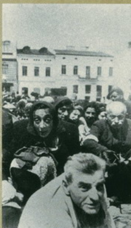
Во время карательных рейдов в Минск в августе 1941 г.