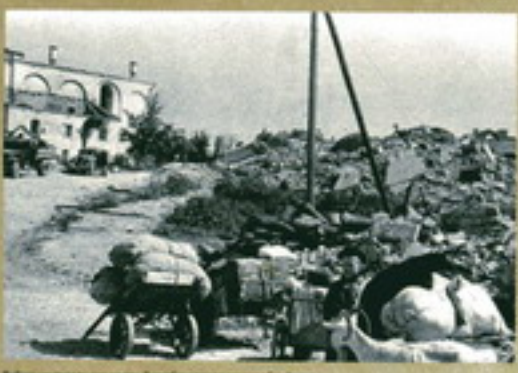
Войсковая колонна в Восточной Белорусии после освобождения. Июль 1944 г.