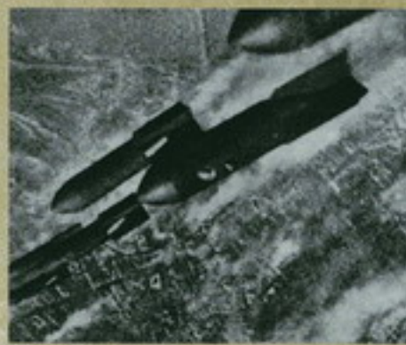
Германский бомбардировщик на взлете в небе в начале 20-х годов. 1941 г.