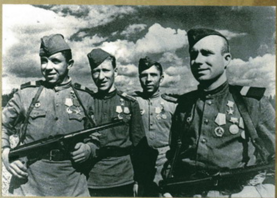
Пять фронтовых солдат в Двинске. Июнь 1944 г.