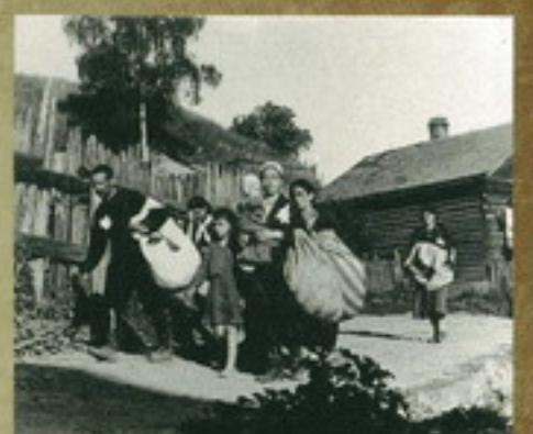
Брестские евреи возвращаются в лагерь Вильгельмштадт. СССР 1941 г.