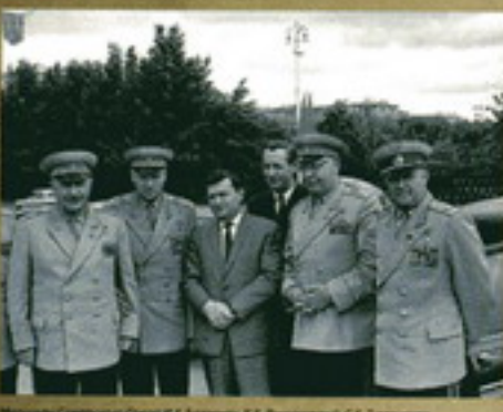
Маршал Советского Союза К.А. Баранов, К.А. Рокотский, С.А. Тимошенко и С.М. Буденный в составе К.Т. Ворошилова, П.М. Магарица и М.С. Шестова. 3 июля 1944 г.