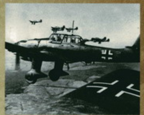
Немецкие бомбардировщики «Юнкерс» Ju-87-2 (штурмовик «кабачок») на взлете в 1940 г. в Бельгии.