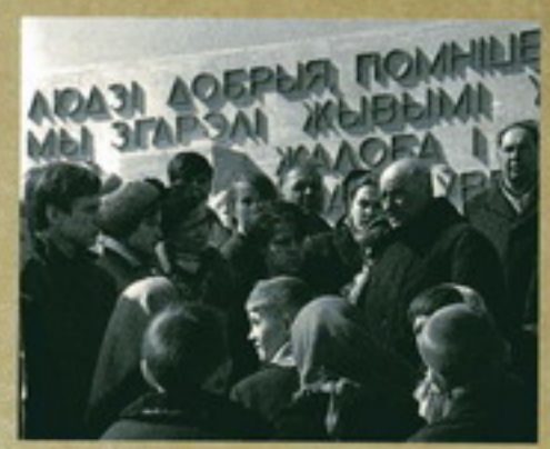
Минский районный советский клуб имени Сталина. Служащие следят за качеством работы. Июль 1945 г.