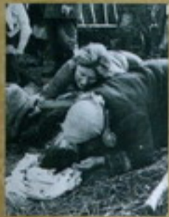
Белорусские женщины выносят раненых, партизанов и обгоревших солдат в тылу. «Историческая фотография» — 4. Беларусь.