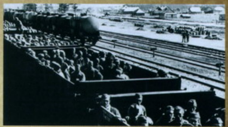
Возврат с советской земли депортированных немцев в Германию. 2 сентября 1947 г. На фото — советские солдаты следят за выгрузкой и отправкой немцев в Берлин. Многие из них уже никогда не вернутся в дома.