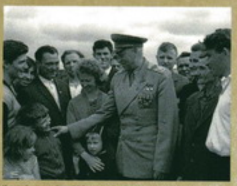
Маршал Советского Союза К.А. Рокотский среди детей. 7 июля 1944 г.