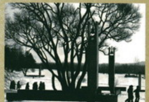
Площадь Калашникова. Минск. 1945 г.