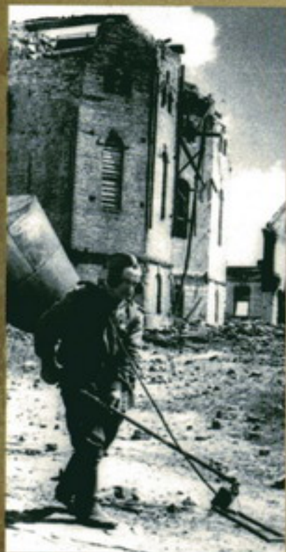
Разрушенный район Пинска в Восточной Белорусии после освобождения от немецкой оккупации. 1944 г.