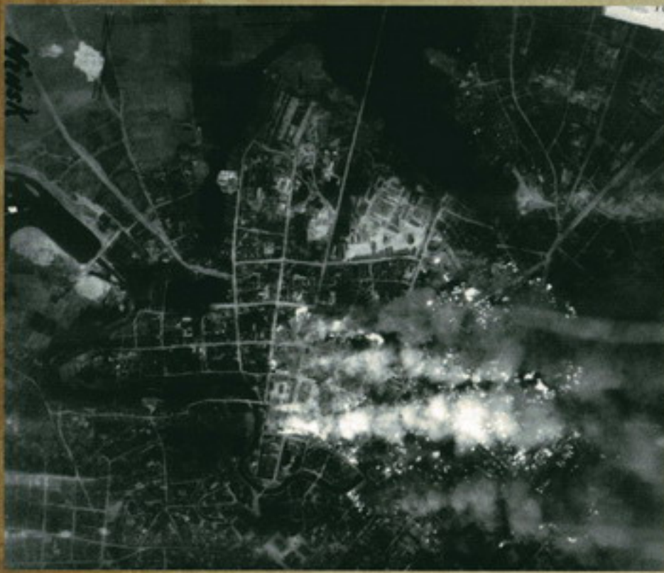
Аэрофото снимок территории Минска после массовых бомбардировок 24-25 июня 1941 г.