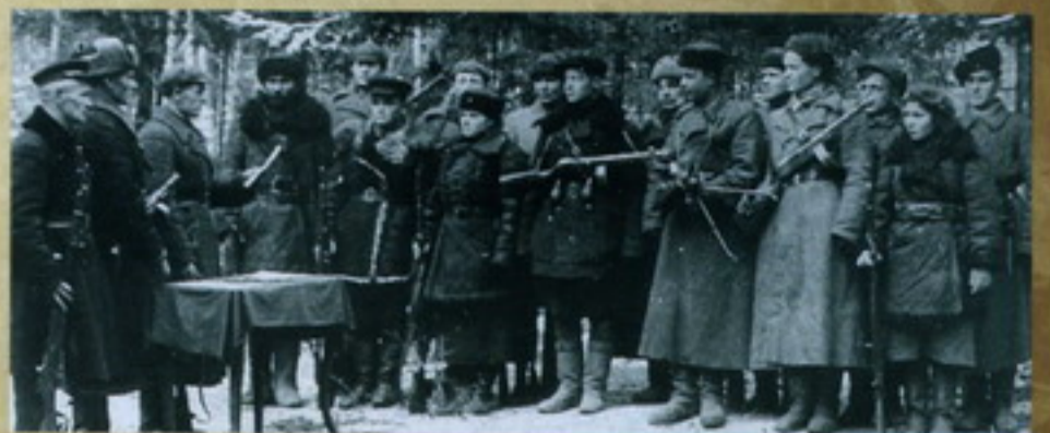
Войдя партизанского отряда имени К.В. Симонова в освобожденный Дзержинск. 1943 г.