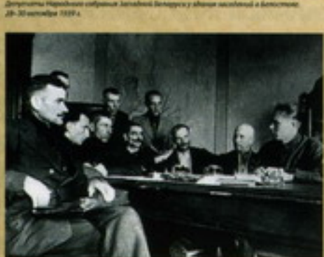
Депутаты Народного собрания Западной Беларуси у здания посольства в Вильнюсе, 29-30 сентября 1939 г.