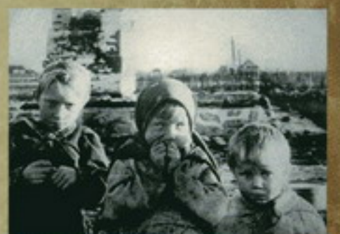
Дети в урне Давид в Варшаве. Польша, 1941 г.