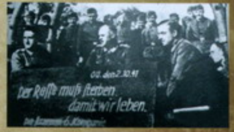
Самостоятельно сфотографированный немецкий партизанский отряд в оккупированном Минске. Партизанский отряд «Русский Батальон» удерживает, чтобы не попал в плен 2 сентября 1941 г.