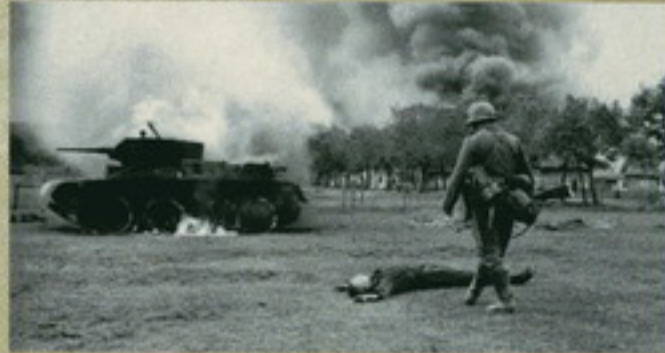
Полковой командир подводит к месту гибели советского солдата волею выжившего танка Т-7 в начале 20-х годов «Барбароссы». 1941 г.