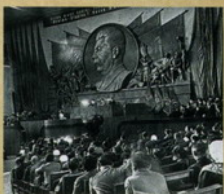
В зале Народного собрания 2-й сессии ВКП(б) в Москве, 1939 г.