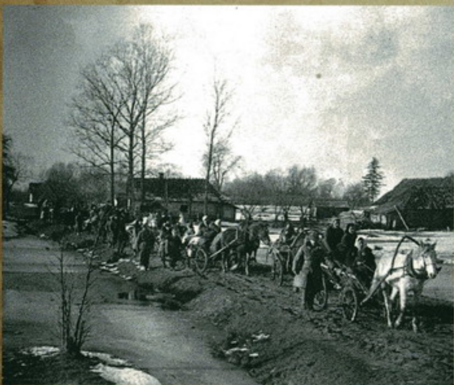
Сельские жители вывозят продукты и подкармливают.

Некоторые фотографии, на которых запечатлен весь ужас, трагизм войны, страдания невинных мирных