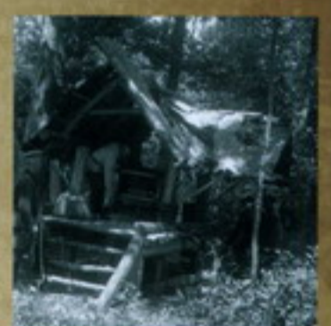
Партизанский лагерь. 1943 г.