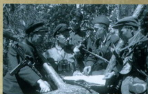
Командир Псковской партизанской бригады М.И. Дроздов с командой в лесу. Партизанский лагерь в оккупированной Беларуси. 1943 г.