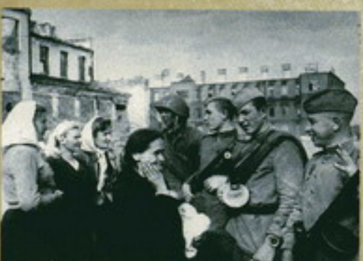
Встреча жителей Восточной Белорусии с войсками Красной Армии. 1944 г.