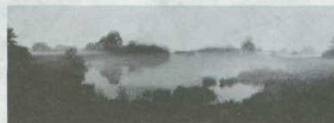
В.Качан. З серыі "Туман".