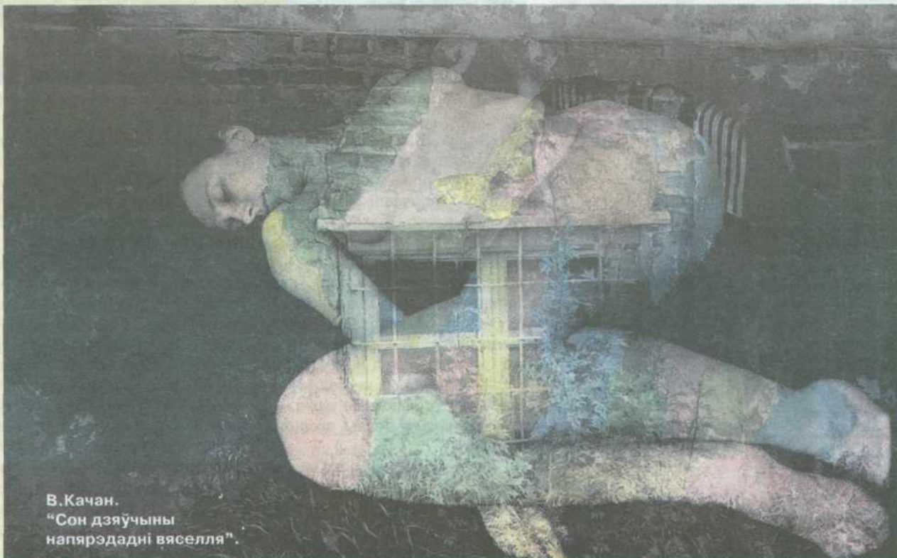
В.Качан. "Сон дзяўчыны наярэдадні вяселля".