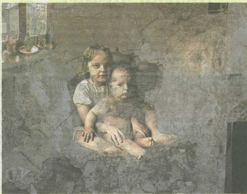
В.Качан. "Забытыя фрэскі маёй памяці №1".