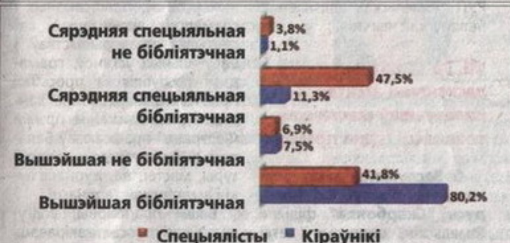
Размеркаванне кіраўнікоў і спецыялістаў бібліятэк па адукацыі.