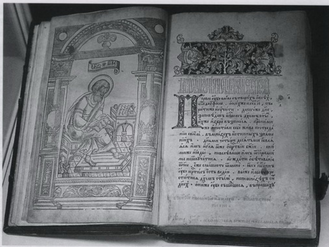
Апостол (Львов: тип. Ивана Федорова, 15 февраля 1574)