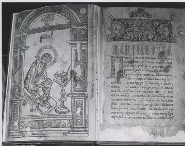
Апостол (М.: тип. Ивана Федорова и Петра Тимофеева Мстиславца, 1 марта 1564)

Проведение конференции особенно актуально в Год культуры России, поскольку издание «Апостола» стало ключевым событием для русского книго-