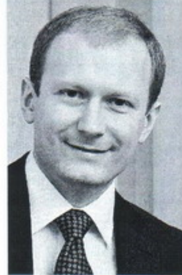
Ведущий методист Национальной библиотеки Беларуси

Значимым событием в библиотечной сфере Беларуси в 2012–2013 гг. стал эксперимент по объединению сельских публичных и школьных библиотек. В связи с чем развернулась дискуссия о целесообразности распространения результатов эксперимента на все библиотеки, расположенные в сельской местности.