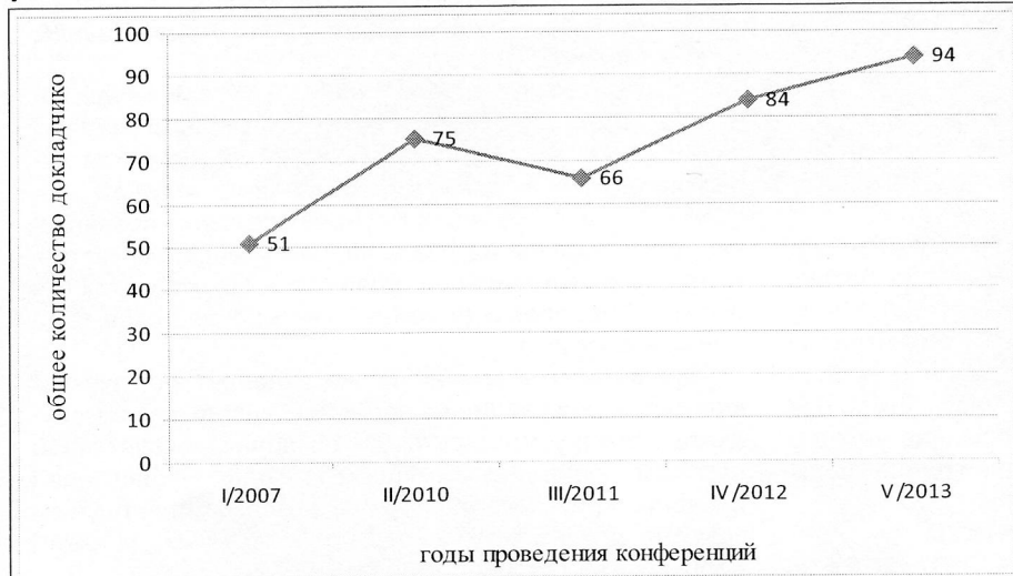
Рис. 2. Участие в работе конференции в 2007–2013 гг. специалистов и молодых ученых, выступивших с докладами

Итоги работы трех конференций (в 2007 и 2010–2011 гг.) позволили сделать вывод не только о необходимости их регулярного проведения, но и привлечении на постоянной основе к их организации профильного вуза – БГУКИ (факультет информационно-документных коммуникаций) – с целью достижения более высокого уровня конференций, что обусловило в дальнейшем положительную динамику их развития. Прежде всего, увеличилось число докладчиков (рис. 2).