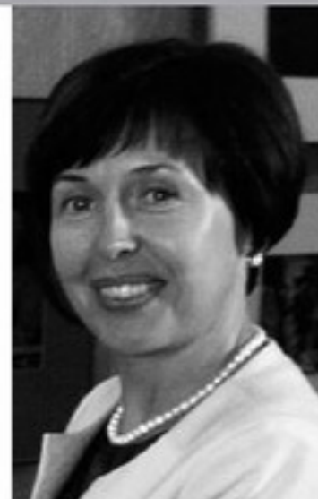
Старшыня Савета Беларускай бібліятэчнай асацыяцыі, першы намеснік дырэктара Нацыянальнай бібліятэкі Беларусі