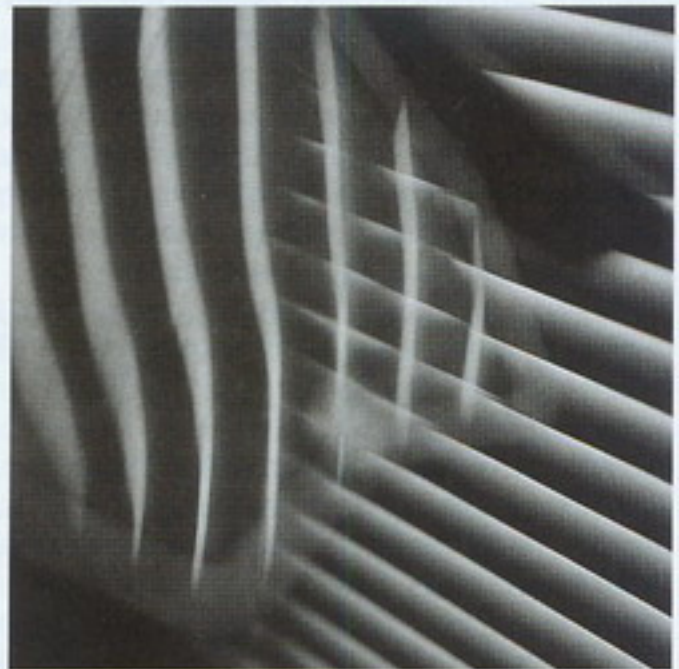
Вадзім Качан. Два бакі (здымак №2). Фота. 2012.

на да «свяцізму» Рыгора Іванова набліжаюцца творы Мікалая Бушчыка, Віктара Васюкевіча, Аляксандра Верашчагіна, Генадзя Фалея.