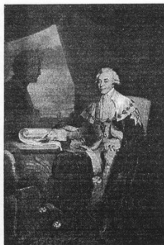
Николай Петрович Румянцев

старинные атласы, вошедшие впоследствии в золотой книжный фонд России.