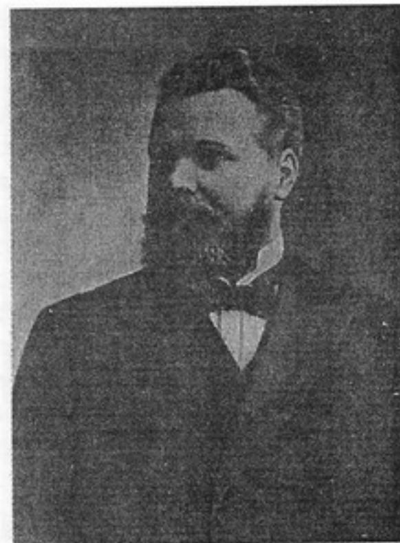
Ефимий (Ефим) Фёдорович Карский