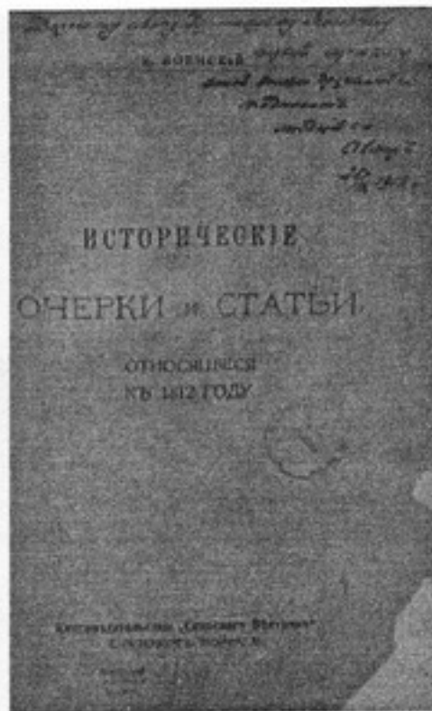
Книга из библиотеки И.Х.Колодеева