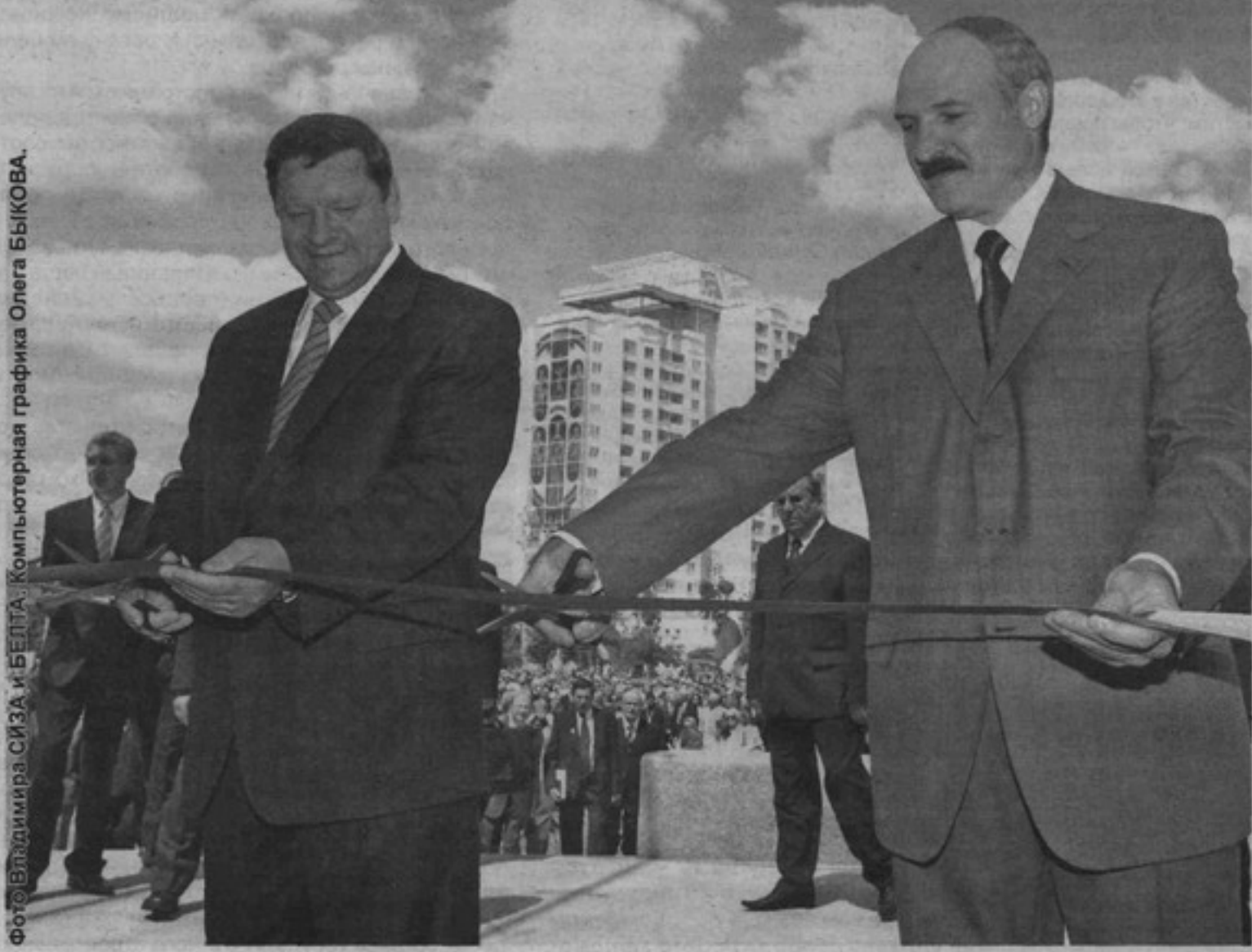
Компьютерная графика Олега БЫКОВА.