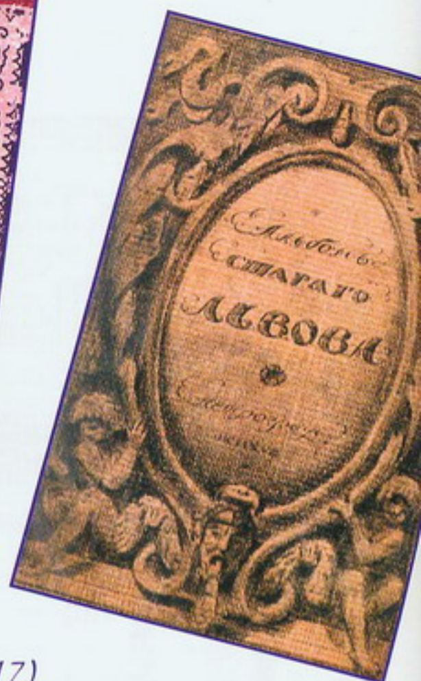
«Татаран» – «Книга песен» (Армения, 1513), «Витебская старина» (Беларусь, 1883), «Кыз-Жибек» (Казахстан, 1936), «Альбом старого Львова» (Украина, 1917)

на территории Украины. Она относится к популярным богослужебным изданиям православной церкви. В издании кроме канонического текста имеется послесловие первопечатника И. Федорова, в котором изложена история создания типографий в Москве, Заблудове и Львове. «Кобзарь» – первый прижизненный сборник (1840) поэзии классика украинской литературы Т.Г. Шевченко. На отдельном листе в книге опубликован рисунок, изображающий кобзаря (народного певца), работы В.И. Штернберга. После издания этого сборника и самого Т.Г. Шевченко стали называть Кобзарем.