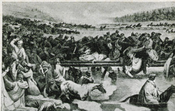
Переходъ французовъ черезъ р. Березину.