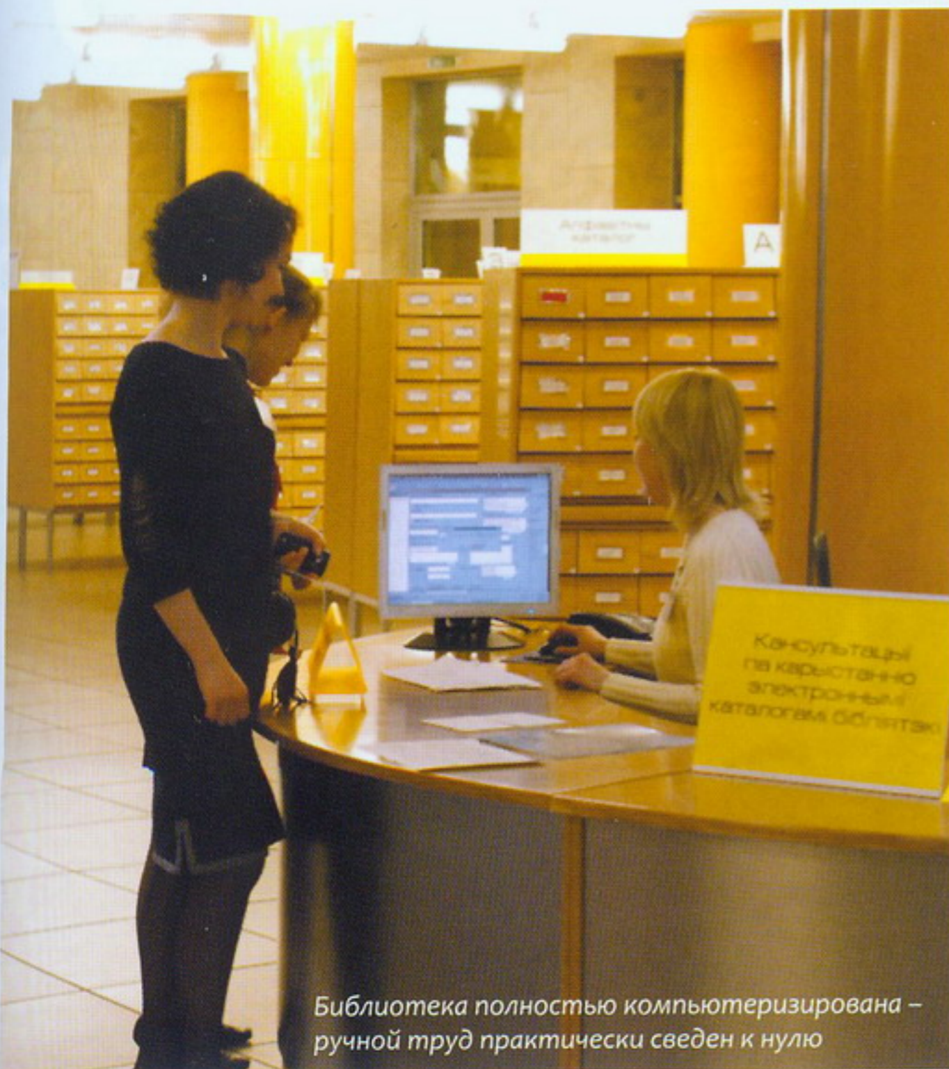
Бібліотека повністю комп'ютеризована – ручної труд практично сведен к нулю

печатников Европы. В библиотеке хранятся более 3 миллионов журналов – с начала XIX века. Также здесь можно найти исторические и военные, топографические и панорамные карты, самые ранние из которых относятся к XVII веку. Ежегодно коллекцию библиотеки пополняют около 250 тысяч изданий.