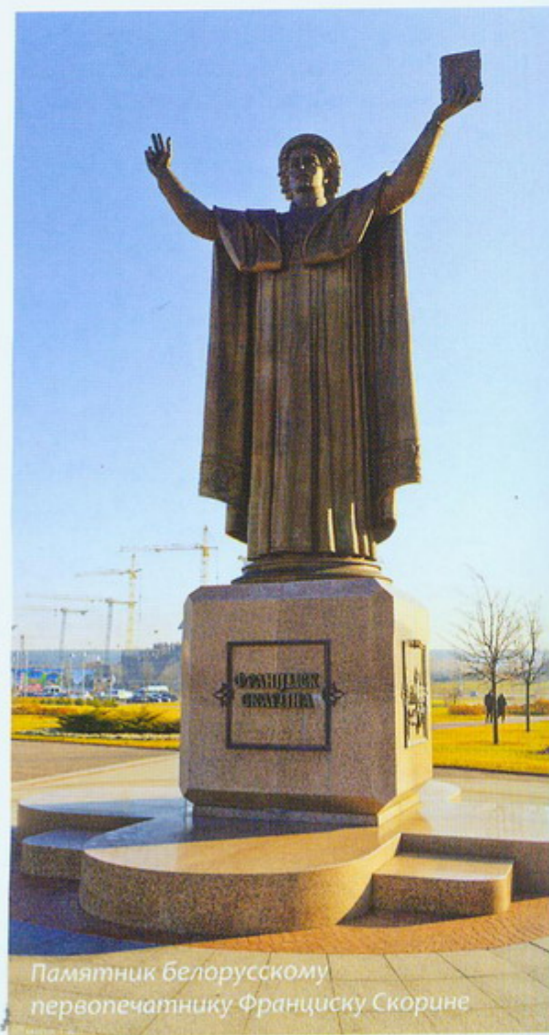
Памятник белорусскому первопечатнику Франциску Скорине