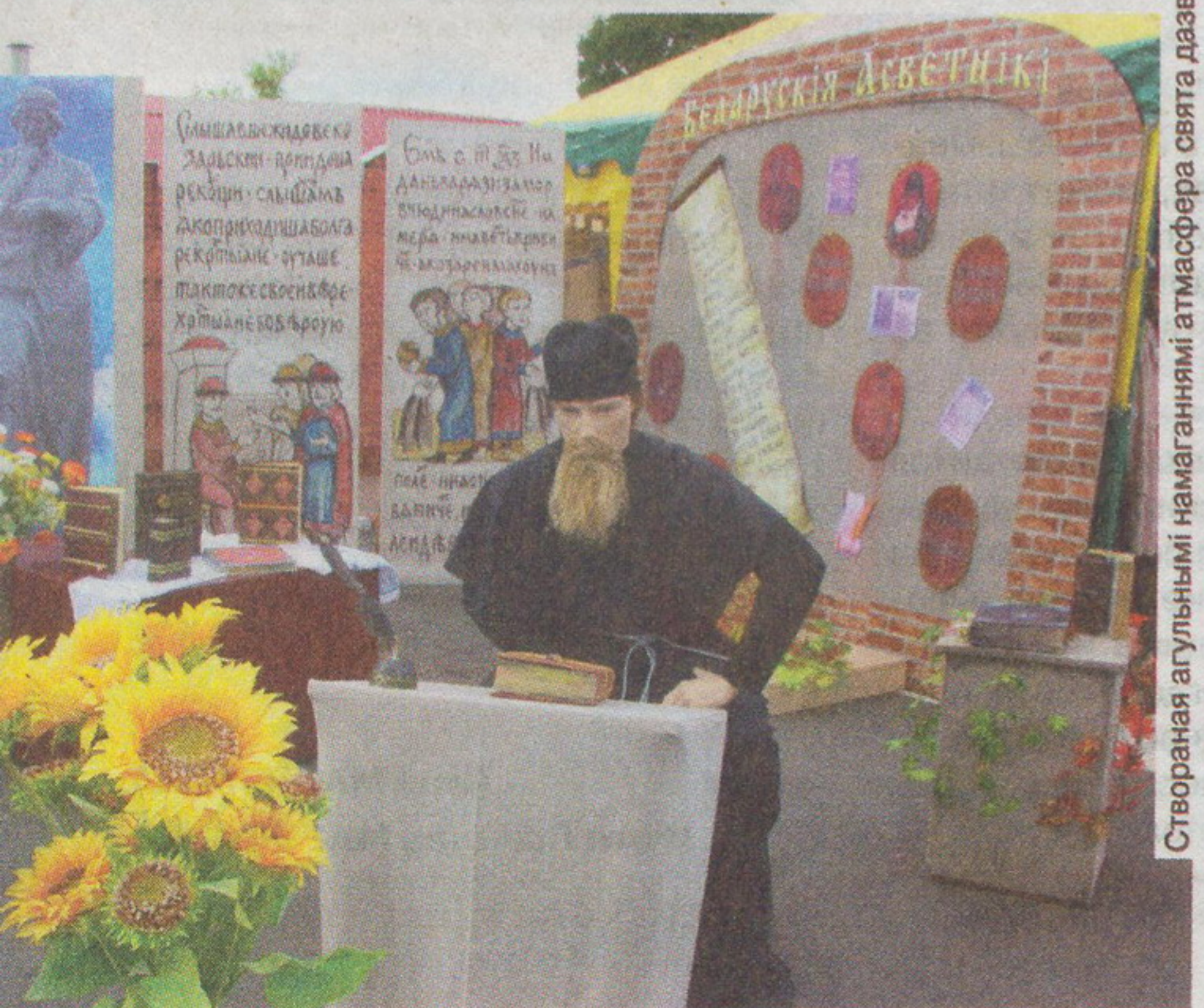
Створаная агульнымі намаганнямі атмосфера свята дазволіла рэальна акнуцца ў гісторыю пісьменства.