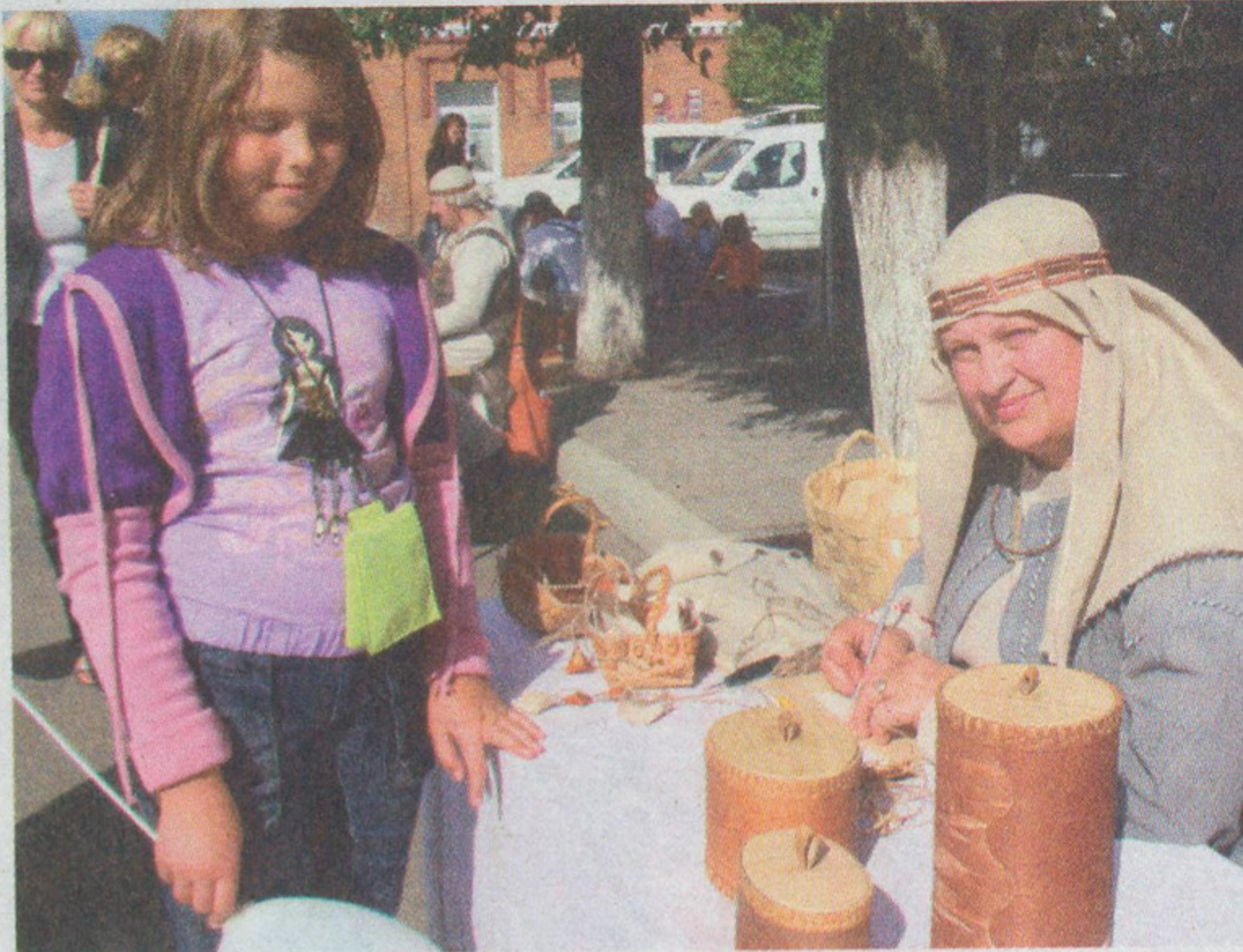
17 верасня ўсе вуліцы Глыбокага былі шчыльна запоўнены ўдзельнікамі свята.

А запачаткаваў традыцыю старажытны Полацк, радзіма вялікіх асветнікаў і культурная сталіца краіны. Глыбоччына таксама мае знакамітых дзеячаў культуры, навукі і мастацтва, якія шчыравалі ў розных галінах ведаў. Падчас свята ў гарадскім скверы была адкрыта алея знакамітых землякоў глыбачан. На ёй устаноўлена восем бюстаў: мецэнату горада Іосіфу Корсаку; заснавальніку беларускага тэатра Ігнату Буйніцкаму; мастаку, пісьменніку, археолагу і фалькларысту Язэпу Драздовічу; публіцысту, пісьменніку і гісторыку, дырэктару першага Беларускага дзяржаўнага музея, акадэміку АН БССР Вацлаву Ластоўскаму; паэту Алесю Дубровічу; герою Савецкага Саюза Пятру Казлову; генеральнаму канструктару авіяцыйнай тэхнікі Паўлу Сухому; Лазару Перальману — стваральніку сучаснай мовы іўрыт дзяржавы Ізраіль. Была адкрыта мемарыяльная дошка ў гонар пісьменніка Лявонція Ракоўскага і архітэктара Клаўдзія Дуж-Душэўскага.