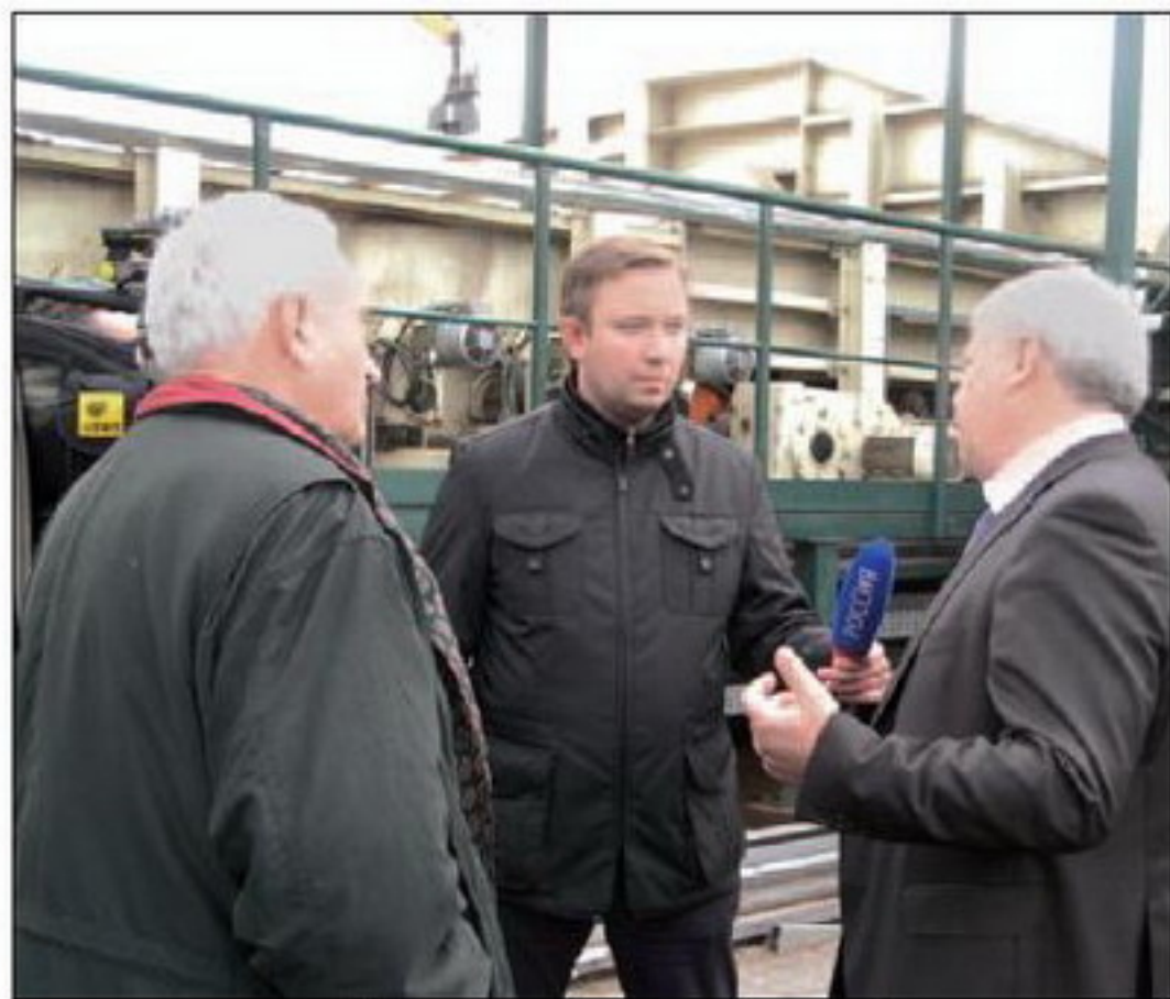
Журналисты на фабрике «Ивацевичдрев».

— Я увидел, что в Беларуси работают высокотехнологичные предприятия, растет производство, а деньги вкладываются в том числе и в расширение социальной сферы. В Кобрине построили десятки километров асфальтированных дорог! Там