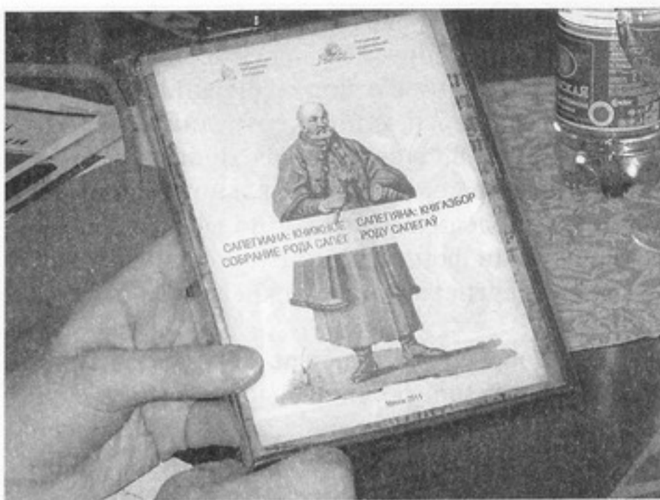
Электронный оптический диск «Книжное собрание рода Сапозжников» (Минск, НББ)