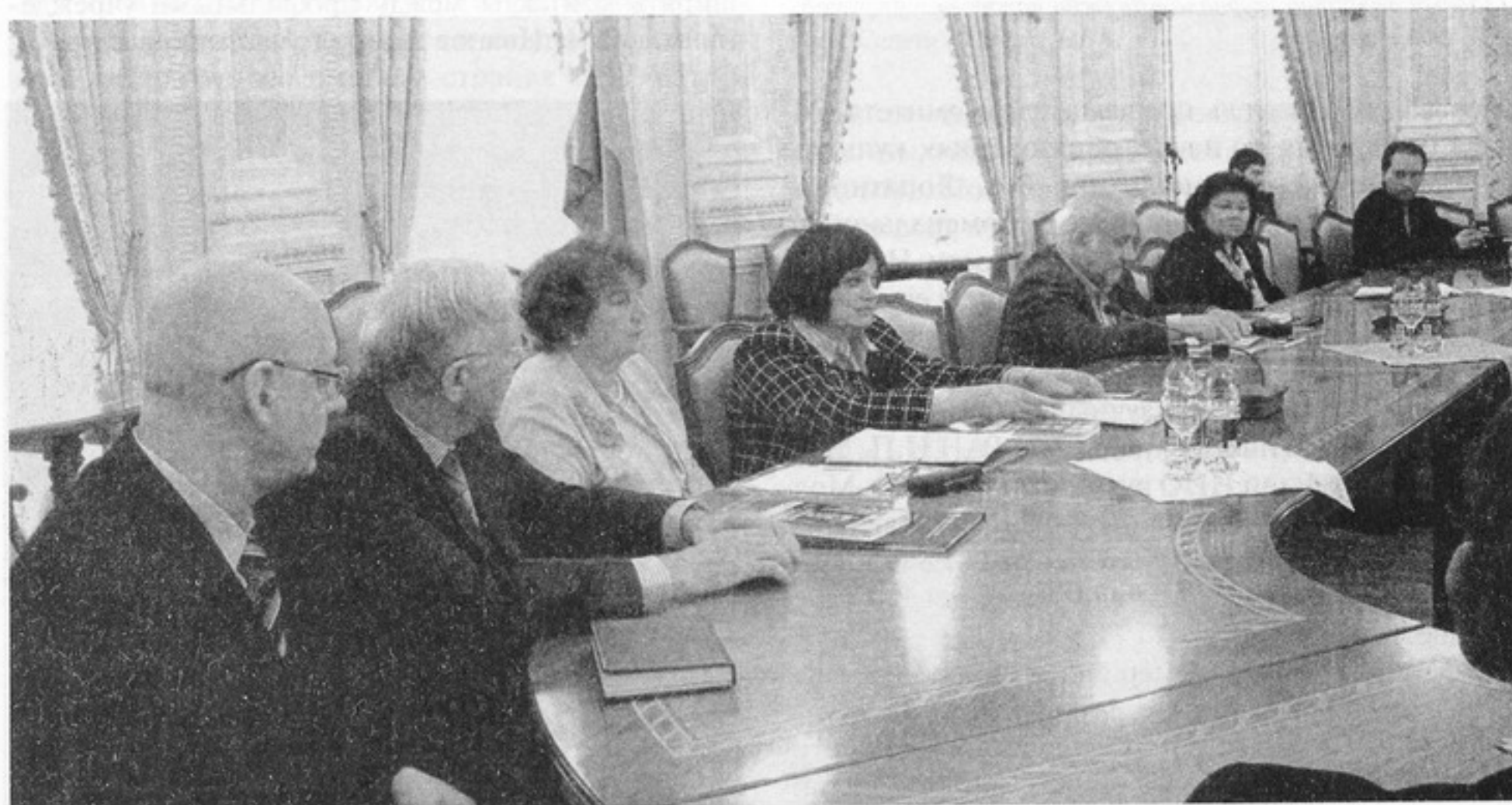
«Румянцевские чтения — 2012». Зал заседаний Посольства Республики Беларусь в Российской Федерации: круглый стол «Культурное сотрудничество: тенденции и перспективы»

Конференция проходила в форме пленарного заседания, работы секций и круглых столов. В рамках «Румянцевских чтений» состоялись пленум Межрегионального комитета по каталогизации (МКК), предсессионные заседания секций РБА, круглый стол «Фонотека в учреждениях культуры: к вопросу сохранения звукового музыкального наследия», круглый стол «Культурное сотрудничество: тенденции и перспективы» (к 20-летию установления дипломатических отношений между Республикой Беларусь и Российской Федерацией) и другие встречи.