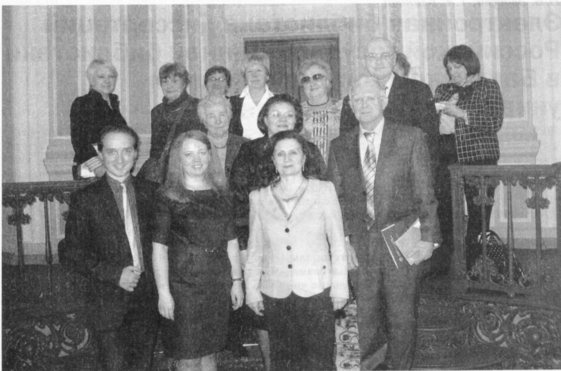
Участники круглого стола

Заместитель генерального директора по научной и издательской деятельности Национальной