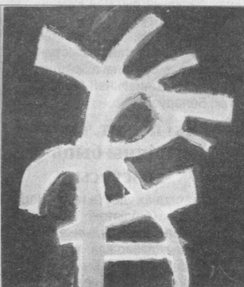
Віктар Шылко. “Знак суму”, палатно, акрыл. 2010.

У XX стагоддзі сітуацыя значна змянілася. Паўуленне радыё і тэлебачання, фота-, кіна- і аўдыядакументаў па-свойму перайначыла свет. Людзі сталі ўсё часцей і часцей даведвацца пра навіны не з газет, а па радыё і тэлебачанні.