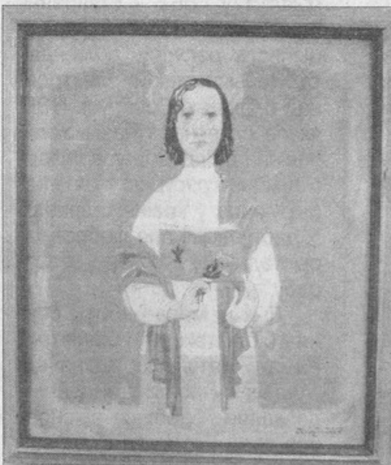
Уладзімір Кожух. “Да Лауры. Вольга”, палатно, алей. 2008.

Трэба заўважыць, што яркім сведчаннем аўтарытэтных нашай галоўнай кніжнай скарбніцы як на нацыянальным, так