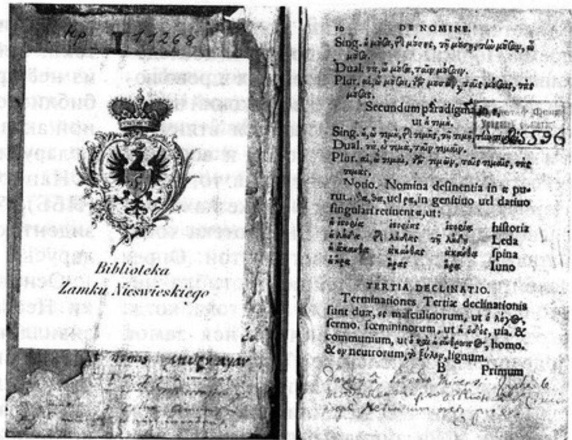
Книга из Несвижской библиотеки Радзивиллов

В XX веке для Несвижской библиотеки снова наступает чёрная полоса, которая закан-