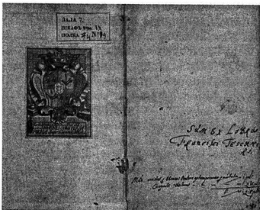
Экслибрис на книге из библиотеки Сапегов

К настоящему времени наиболее исследованной является книжная коллекция, переданная Львом Сапегой Виленской иезуитской академии. Сейчас в библиотеке Вильнюсского университета хранятся около 300 томов книг (из переданных в своё время 3000 экземпляров), которые составляют одну из ценнейших коллекций библиотеки университета. В изданном библиотекой каталоге подробно описаны 249 книг, размещён качественный иллюстративный материал, а также достаточно подробно описаны 34 старопечатные книги из первой библиотеки Сапегов, которые ныне хранят-