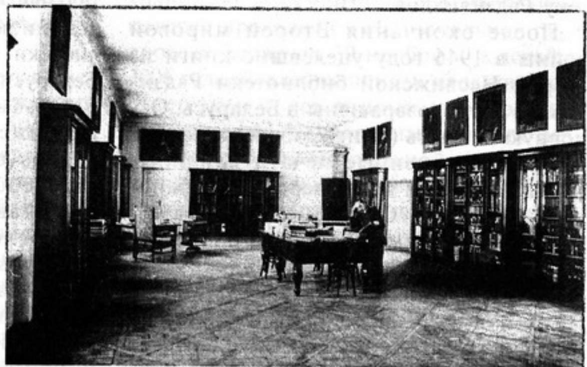
Фото Несвижской библиотеки Радзивиллов (конец XIX века)