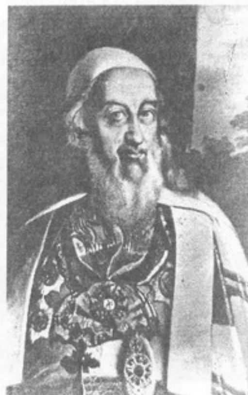
Мітрапаліт Іраклій Лісоўскі, заснавальнік Полацкай духоўнай семінарыі

Бібліятэка езуіцкай акадэміі была найбуйнейшым кніжным зборам пры каталіцкай навучальнай установе ў Полацку. Актыўна займаліся адукацыйнай дзейнасцю і дасягнулі ў гэтым значных поспехаў і ўніаты. Буйнейшай уніяцкай навучальнай устаноўай у горадзе стала Полацкая духоўная семінарыя (Беларуская духоўная семінарыя), якая была заснавана мітрапалітам Іракліем Лісоўскім у 1806 годзе. Яна праіснавала да ліквідацыі уніі ў Беларусі ў 1839 годзе, а пасля была пераўтворана ў праваслаўную духоўную семінарыю [1, с. 466–467; 2, с. 148–157]. У 1820-я гады вялася падрыхтоўка да адкрыцця на базе семінарыі вышэйшай навучальнай установы – уніяцкай духоўнай акадэміі, якая была б здольная процістаяць Галоўнай духоўнай семінарыі пры Віленскім універсітэце (у апошнія ўніаты навучаліся сумесна з каталікамі і маглі патрапіць пад уплыў апошніх, што не надта падабалася ўладам). Аднак дадзены праект не быў рэалізаваны з-за слушнага меркавання, што стварэнне акадэміі будзе спрыяць згуртаванню і ўзмацненню ўніяцкай царквы [3, с. 117–121]. У 1856 годзе, ужо пасля ліквідацыі уніі, семінарыя была пераведзена ў Віцебск, дзе праіснавала да 1917 года [1, с. 464–465].