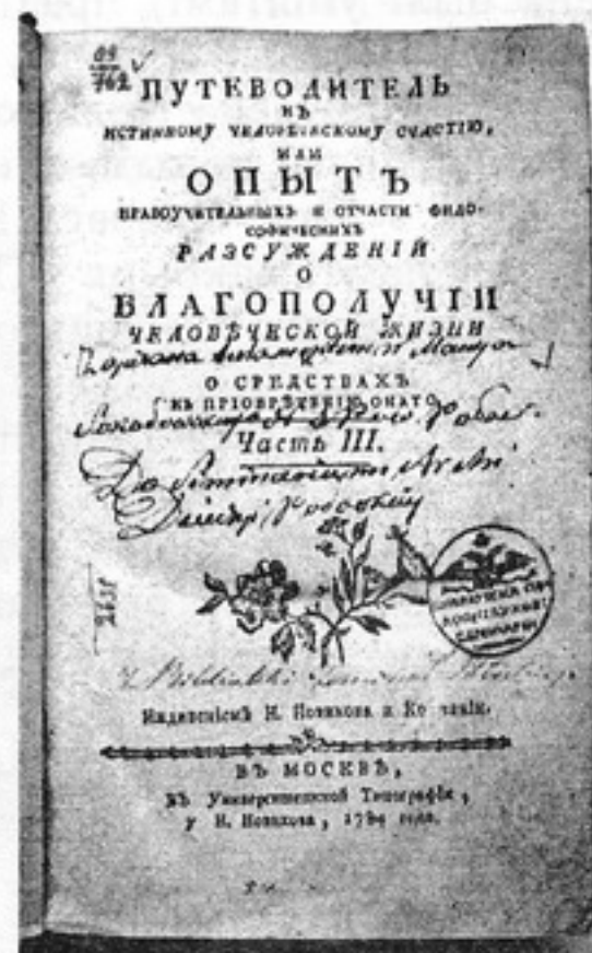
Кніга з пазнакамі аб прыналежнасці да бібліятэкі Полацкай духоўнай семінарыі

Кнігазбор семінарыі папаўняўся выданнямі розных хрысціянскіх канфесій, тут