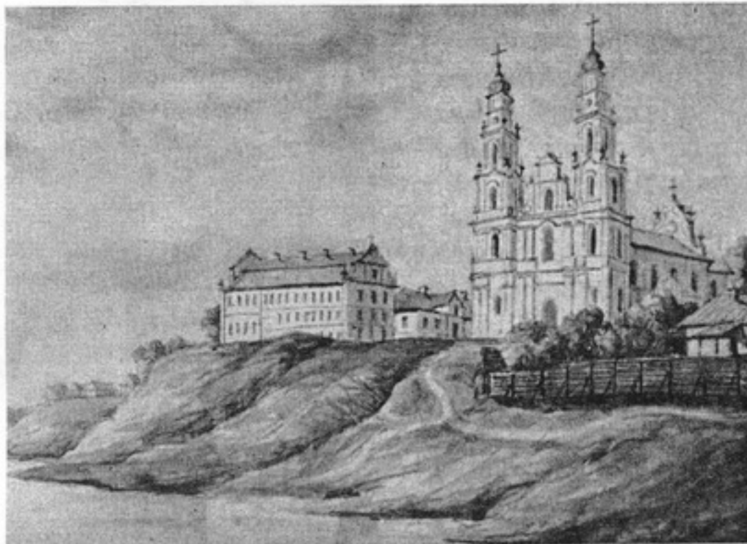
Полацкая духоўная семінарыя (малюнак Напалеона Орды з відам на базыльянскі манастыр пры Сафійскім саборы, дзе знаходзілася семінарыя)

Для бібліятэкі Полацкай духоўнай семінарыі былі адведзены асобныя памяшканні. За паступленнем літаратуры сачылі прэфекты (інспектары) семінарыі. Першапачаткова прыналежнасць кніг да семінарскай бібліятэкі пазначалася рукапіснай адзнакай на польскай мове «Z Biblioteki Seminar Połockiego», пазней – друкаваным штампам «БИБЛИОТЕКА ПОЛОЦК: ДУХОВ: СЕМИНАРИИ», які звычайна прастаўляўся на тытульным лісце выдання. У 1856 годзе бібліятэка разам з семінарыяй