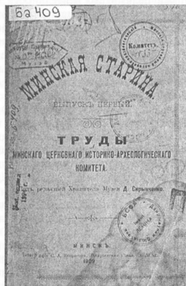
Первый выпуск «Минской старины»