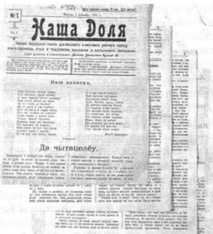
Первая легальная газета на белорусском языке «Наша доля»

С закрытием «Нашай нівы» белорусское литературно-художественное движение полгода не имело печатного органа. Однако уже в феврале 1916 года в Вильно начала выходить газета « Гоман », а в Петрограде с ноября того же года — « Дзяніца » («Денница») и « Swietač » («Светоч»). Газета «Гоман» выходила 2 раза в неделю (1916–1918), печаталась латиницей и кириллицей. На её страницах размещались материалы о белорусском возрождении. «Денница» (редактор — Т. Гартный) продолжила демократиче-