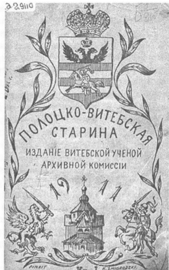
Обложка сборника «Полоцко-Витебская старина»

Революция 1905–1907 годов, которая принесла на белорусские земли — пусть и на короткий срок — свободу слова и печати, содействовала возобновлению книгоиздания на родном языке. Книги, напечатанные на белорусском языке, получили право на легальное существование, что позволило организо-