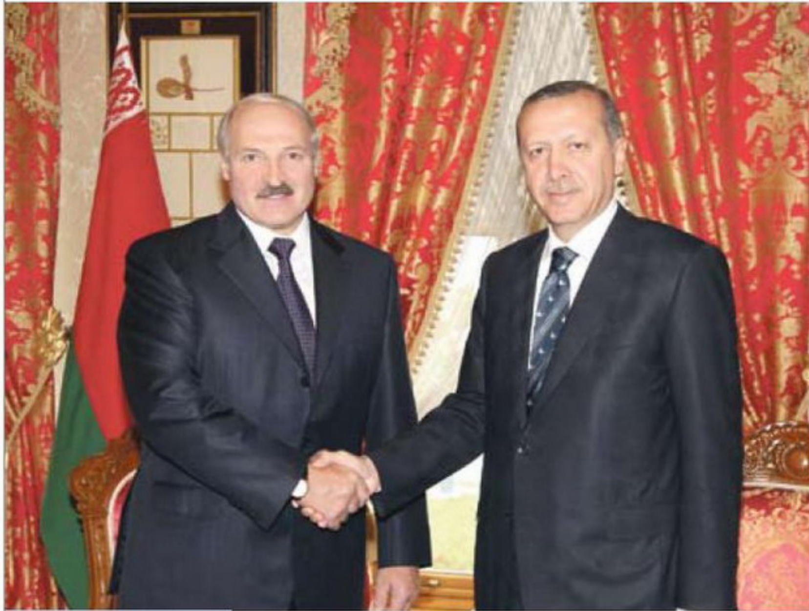
Сустрэча Прэзідэнта Беларусі Аляксандра Лукашэнкі з прэм'ер-міністрам Турцыі Рэджэпам Таіпам Эрдаганам. Стамбул, 2010 год

і выкінуць зброю. Тут вельмі важна зразумець другі бок, чаму ён прытрымліваецца пазіцыі, з якой ты не згодны. Асабліва гэта важна на стадыі перамоваў. Напрыклад, Расія па-ранейшаму падтрымлівае рэжым Башара Асада – мы павінны зразумець і гэ-