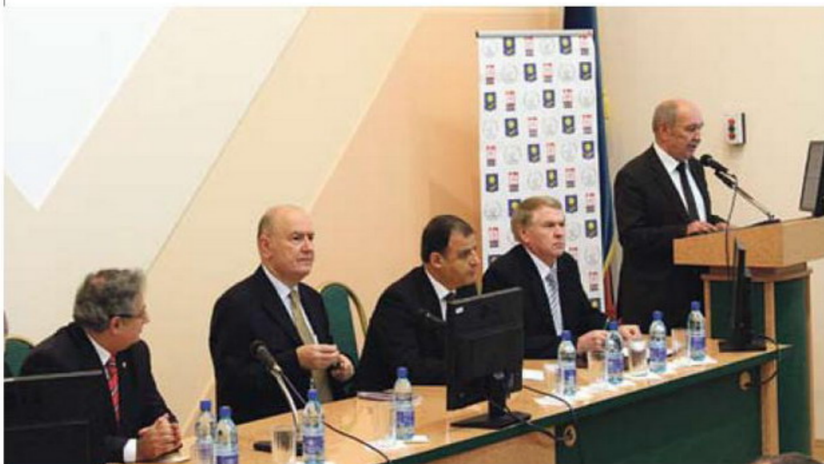
V Міжнародная навукова-практычная канферэнцыя «Педагагічная адукацыя ва ўмовах трансфармацыйных працэсаў: метадалогія, тэорыя, практыка»

– Ёсць пэўныя працэдурныя і тэхнічныя пытанні. Гэтае пагадненне павінна быць ухвалена парламентамі дзвюх краін, што зойме пэўны час. Для беларусаў яго ўвядзенне будзе мець больш сімвалічнае значэнне. Вашы грамадзяне ўжо цяпер могуць атрымаць візу непасрэдна ў аэрапорце па прылёце ў Турцыю. Вельмі добра развітая (і гэты працэс працягваецца) турыстычная інфраструктура прыцягнула да сябе ўвагу беларускіх турыстаў: наша краіна стала адным з найбольш папулярных месцаў адпачынку. Апошнім часам штогод каля 150 тысяч беларусаў прылятаюць у Турцыю. Нягледзячы на тое, што гэта колькасць можа здацца невялікай на фоне агульнай колькасці