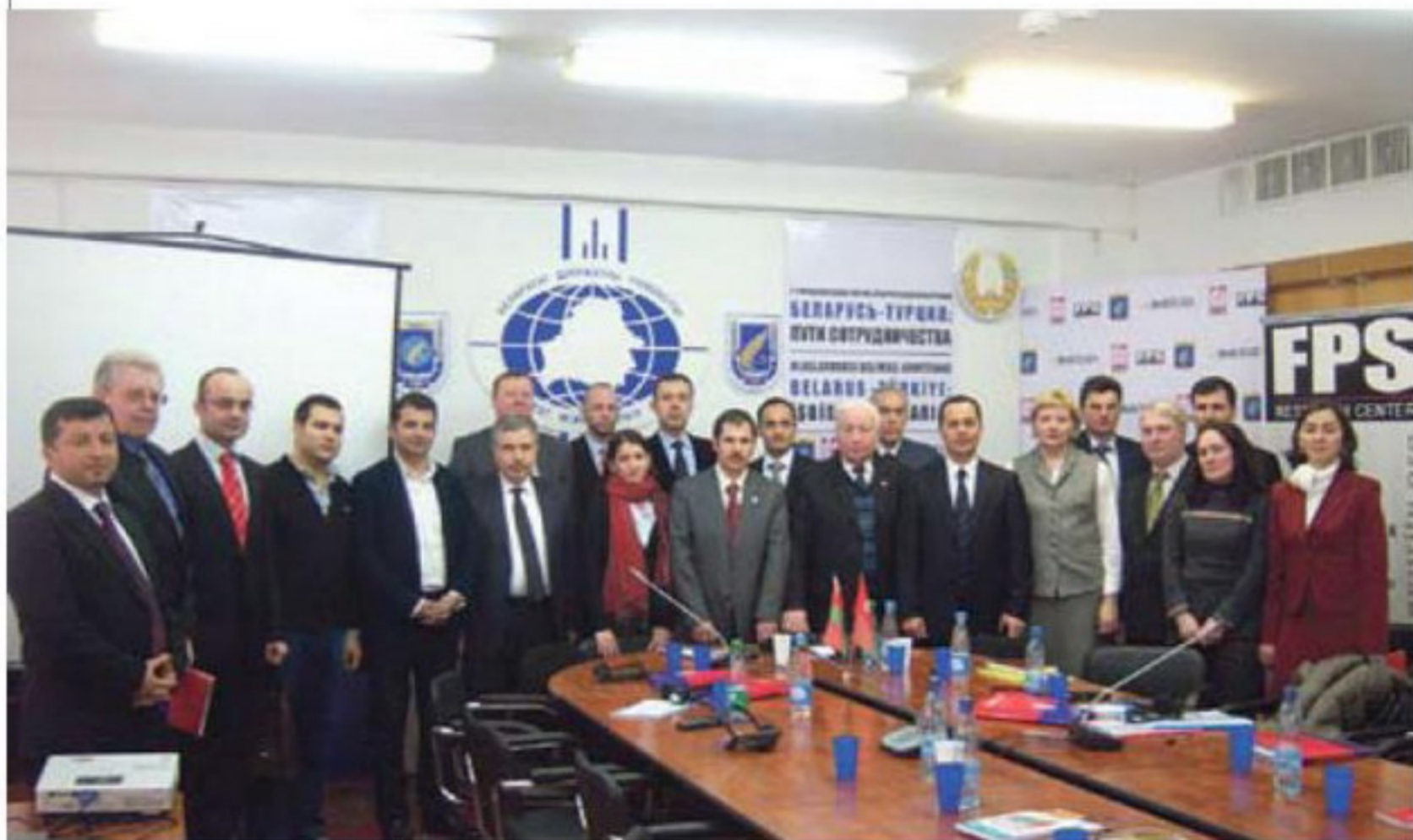
На 2-й міжнароднай навукова-практычнай канферэнцыі «Беларусь – Турцыя: шляхі супрацоўніцтва»

– Тое, пра што вы кажаце, можна парознаму назваць: новая сіла рэгіёна, новы лідар. Але гэта моц, уплыў з’явіліся не знянацку, а сталі вынікам пэўнага гістарычнага працэсу. Нельга казаць, што мы ставілі такую мэту «стаць лідарам рэгіёна», але развіццё нашай краіны прывяло да таго, што мы дасягнулі таго ўплыву, які маем зараз. Ды і што такое гэта лідарства? Турцыя вельмі адрозніваецца ад Ірана, ад арабскіх краін. Я добра знаёмы з сітуацыяй у краінах Усходу. Два гады я пражыў у Лівіі, чатыры гады – у рэгіёне Персідскага заліва. Даводзілася быць і ў Егіпце, і ў Тунісе. Усе гэтыя арабскія краіны настолькі розныя, што нават мова ў