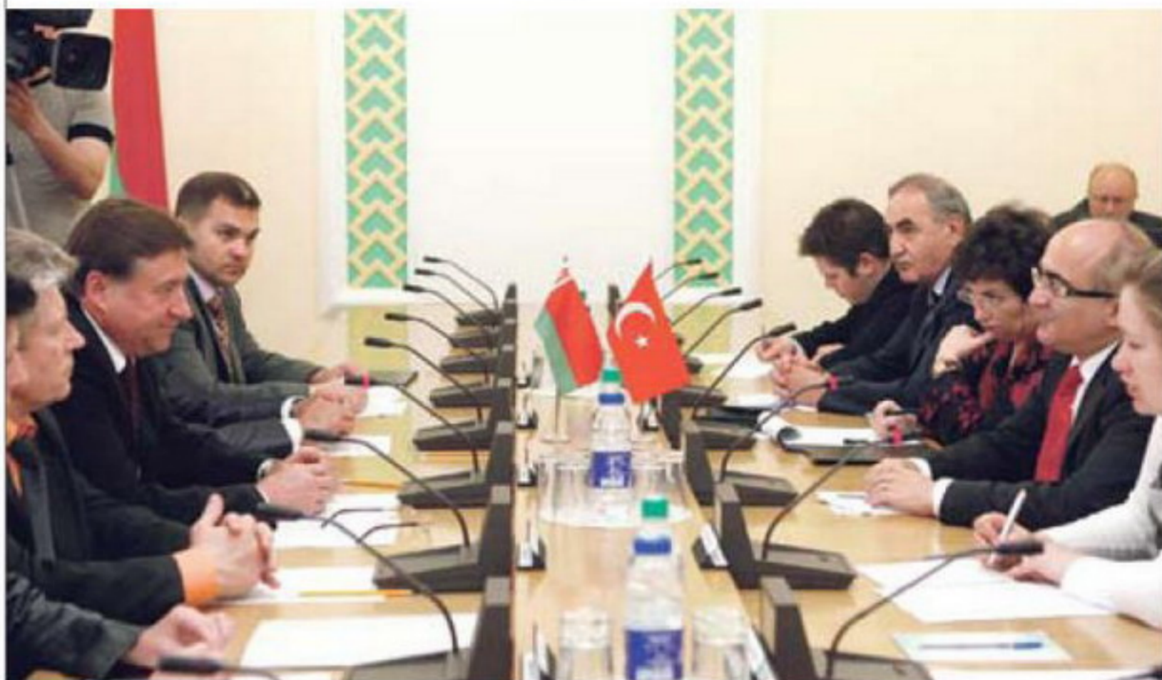
У час сустрэчы міжпарламенцкай групы дружбы «Турцыя – Беларусь». 2010 год

– Турцыя, дарэчы, стала адной з першых краін, што прызналі незалежнасць Беларусі. Дыпламатычныя адносіны паміж дзяржавамі былі ўсталяваны 25 сакавіка 1992 года. І ў гэтым годзе мы адзначаем