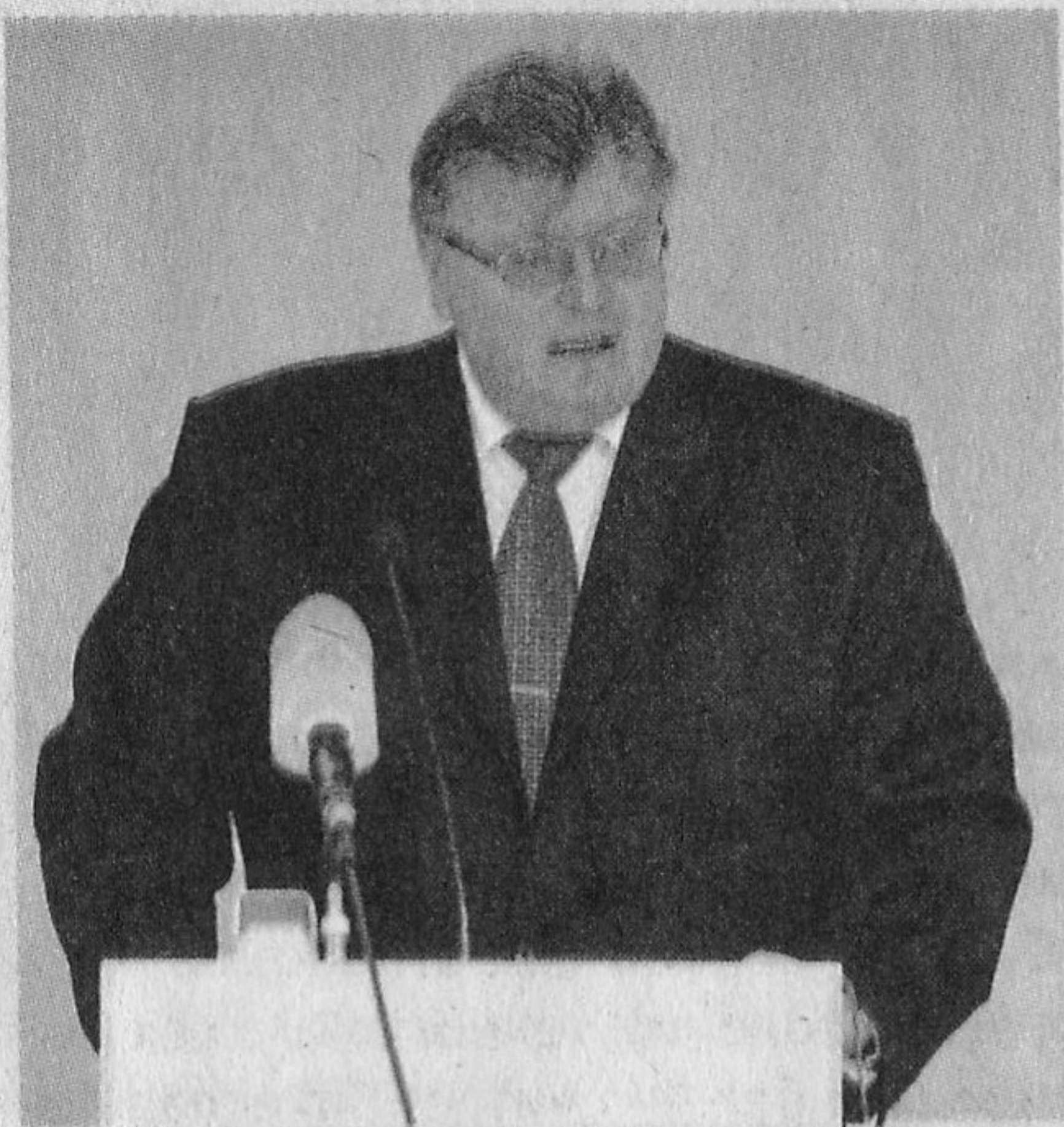
■ Министр информации Беларуси Олег ПРОЛЕСКОВСКИЙ выступает в городской ратуше.

VII Белорусский международный медиафорум «Партнерство во имя будущего: модели новой эпохи» открылся вчера в Минске