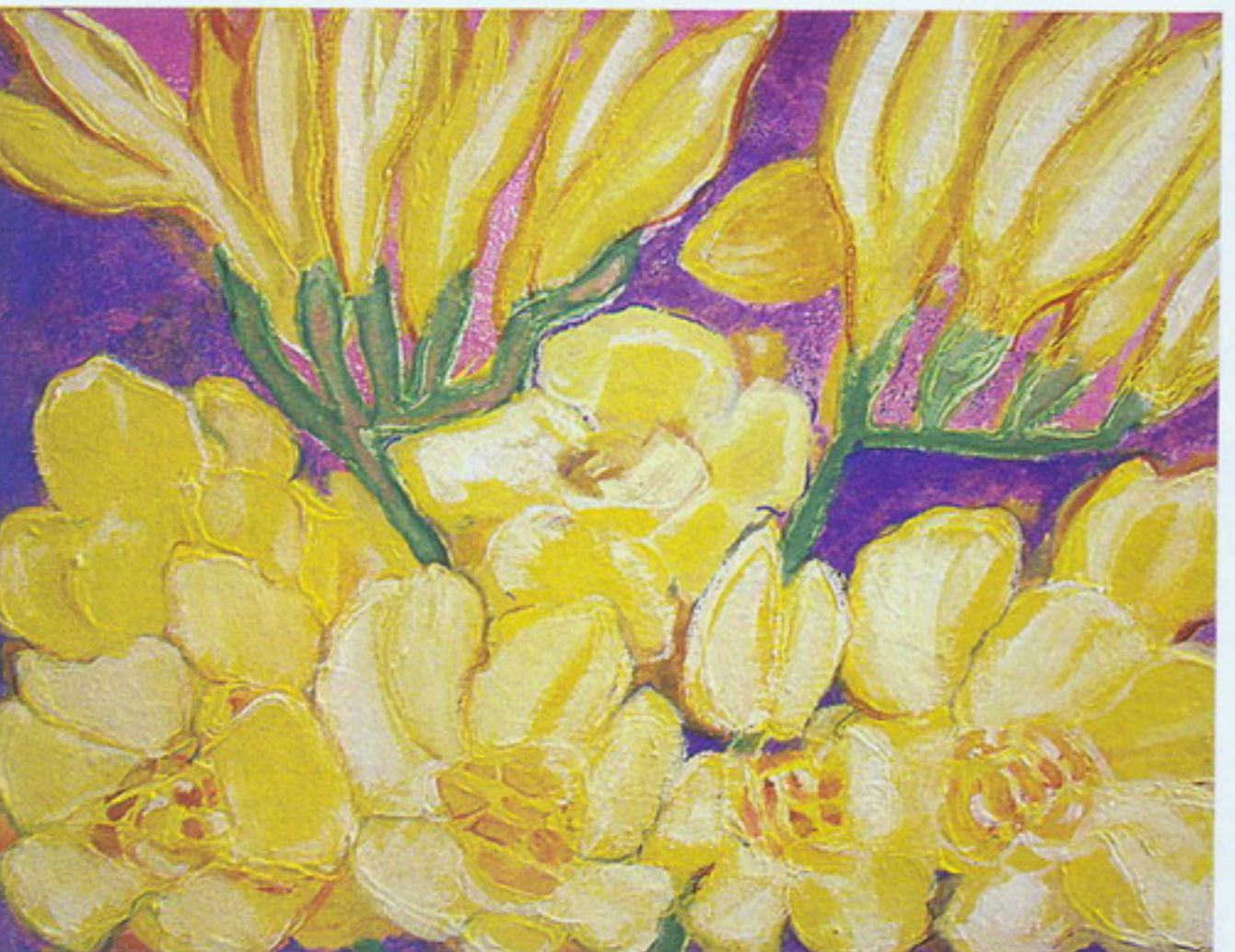
Цюльпаны. Тэмпера, акрыл. 2001.