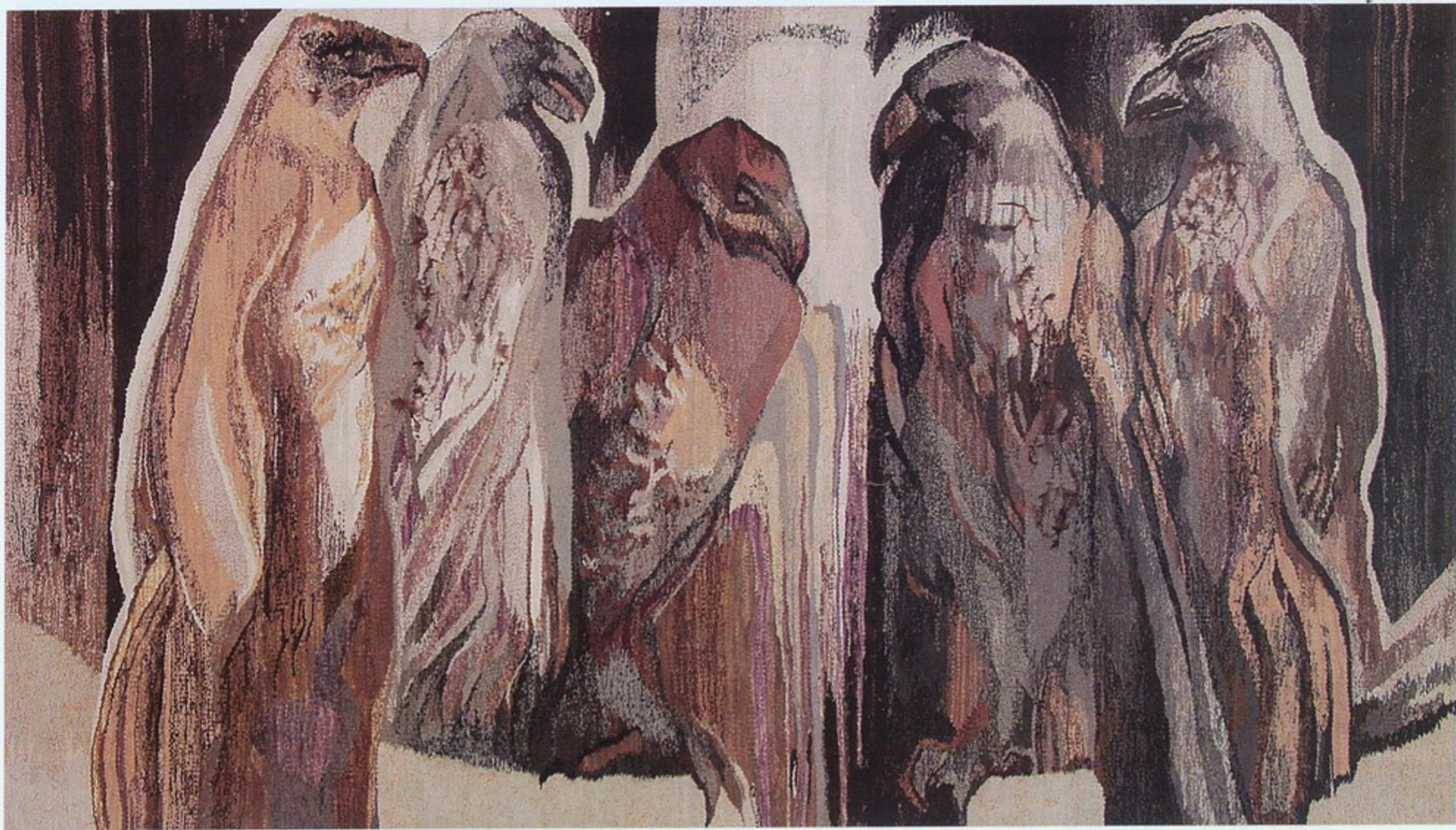
Дыялог. 3 трыпціха «Дыялог». Габелен. 2001.

крыло і апірышча — бацькоўскі дом і сям'я на Беларусі, другое — дзеці, муж і яго вялікая і дружная сям'я ў Турцыі, якая з вялікай павагай ставіцца да творчых памкненняў мастачкі і ўсімі сіламі спрыяе іх рэалізацыі. На цяперашняй, трэцяй па ліку, персанальнай выстаўцы Ганны ў гэтай краіне яе сакральным цэнтрам стаў вобраз таго самага лебедзя — вялікае жывапіснае палатно «Белыя крылы» (2012), напісанае спецыяльна для экспазіцыі. Сэнс карціны шматпластовы і не вычэрпваецца асабістымі перажываннямі. Не толькі Ганна, але і прыхільнікі яе творчасці ў Турцыі бачаць у міфічнай птушцы сімвал Беларусі — краіны пад белым покрывам зімы, дзе жывуць прыгожыя і таленавітыя людзі.