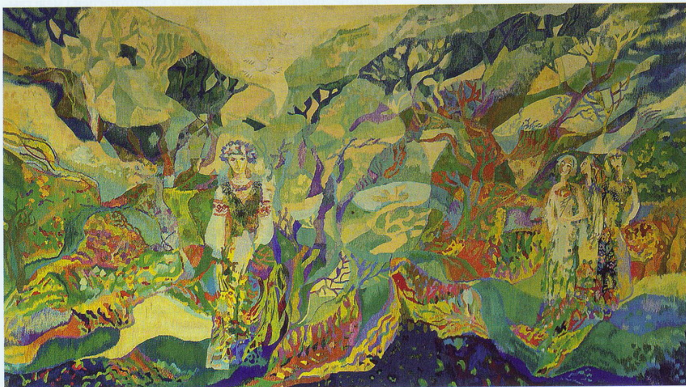
Матылькі. Габелен. 1999.