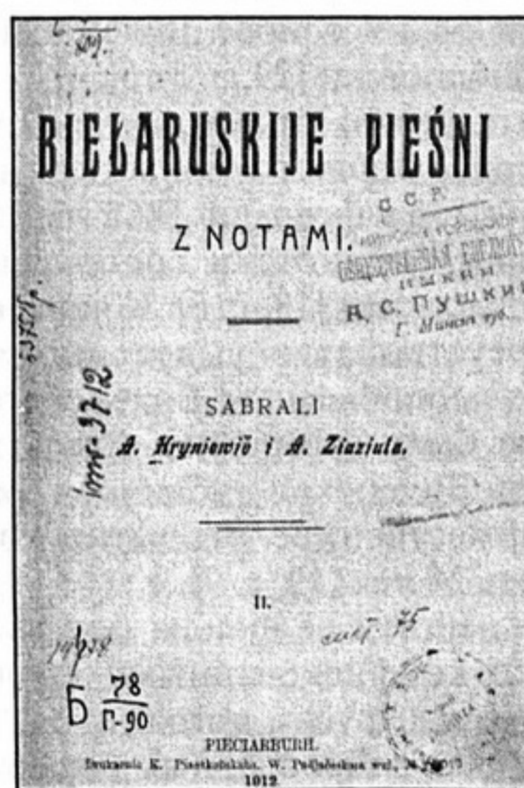
Книга из собраний Минской городской общественной библиотеки имени А.С.Пушкина