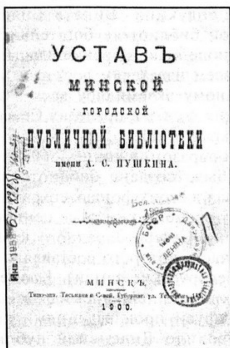
Устав Минской городской публичной библиотеки имени А.С.Пушкина

Подъём в развитии народных библиотек продолжался недолго. В 1912 году были утверждены новые «Правила о народных библиотеках при низших учебных заведениях», согласно которым они поступали в полное распоряжение и под контроль учебных заведений и фактически приравнивались к школьным. Снова был установлен запрет на приобретение демократической литературы. Необходимость