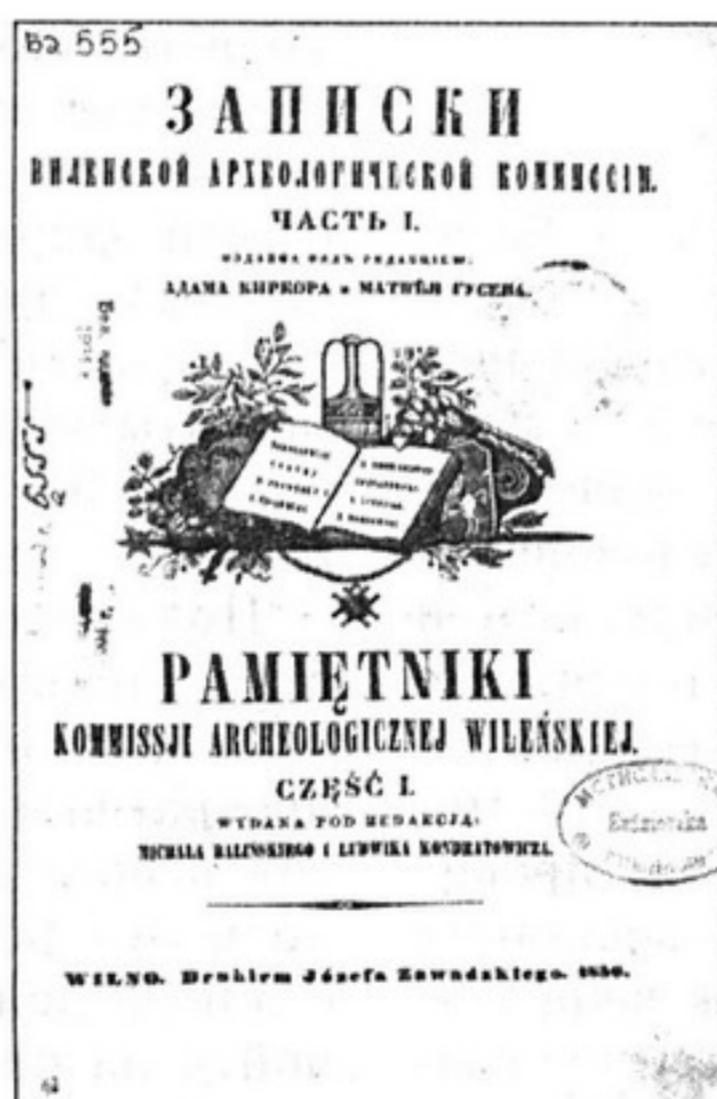
Книга из библиотеки Метиславской гимназии