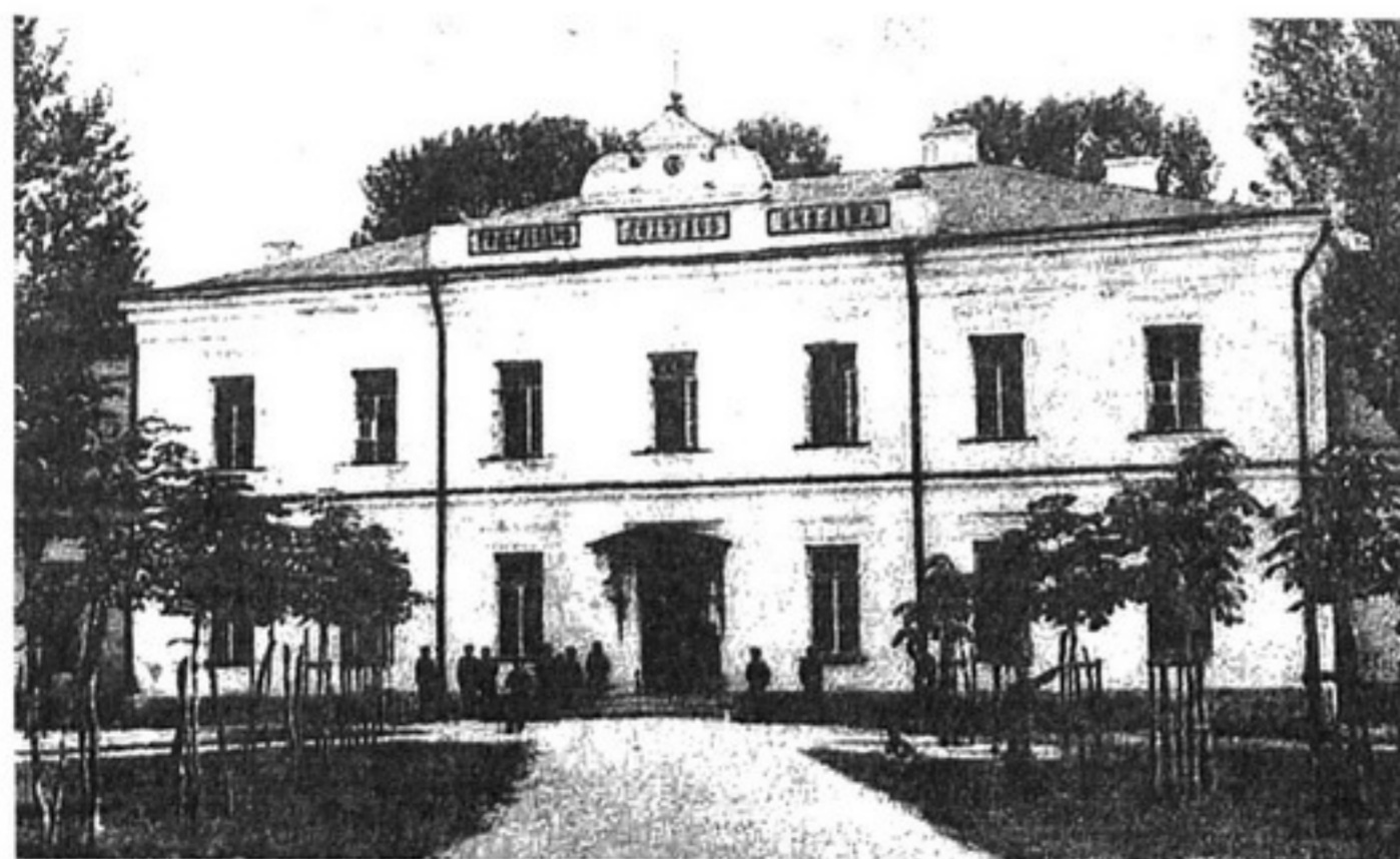
Гомель. Духовное училище

В начале XX века значительно выросло количество начальных школ. Однодневная перепись, проводившаяся в Российской империи 18 января 1911 года, зафиксировала в Виленском учебном округе 8973 начальные школы, две трети из которых (5920) имели учительские библиотеки. Собрания учебных пособий были в 6913 (77%) школах, а в 3495 (39%) — коллекции книг для внеклассного чтения.