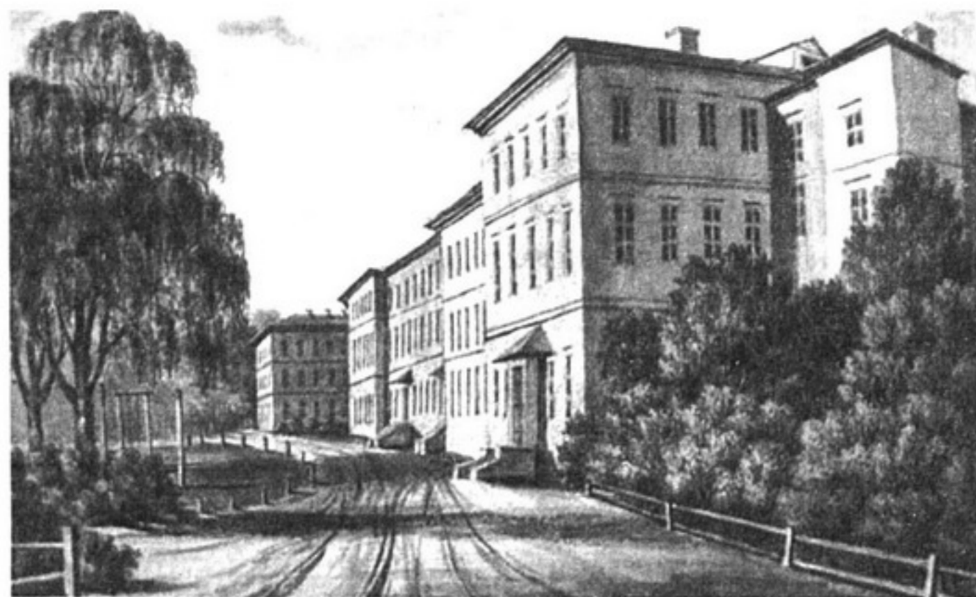
Горы-Горецкий земледельческий институт (рисунок Н.Орды)