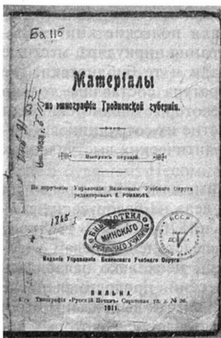
Книга из библиотеки Минского реального училища

Во время подготовки и проведения революции 1905–1907 годов царское правительство вынуждено было снять некоторые ограничения, установленные ранее на деятельность библиотек. В декабре 1905 года были отменены решение об обязательном просмотре Министерством народного просвещения каталогов народных библиотек, а также Правила о бесплатных народных читальнях и порядке надзора над ними. В феврале 1906 года Министерство народного просвещения