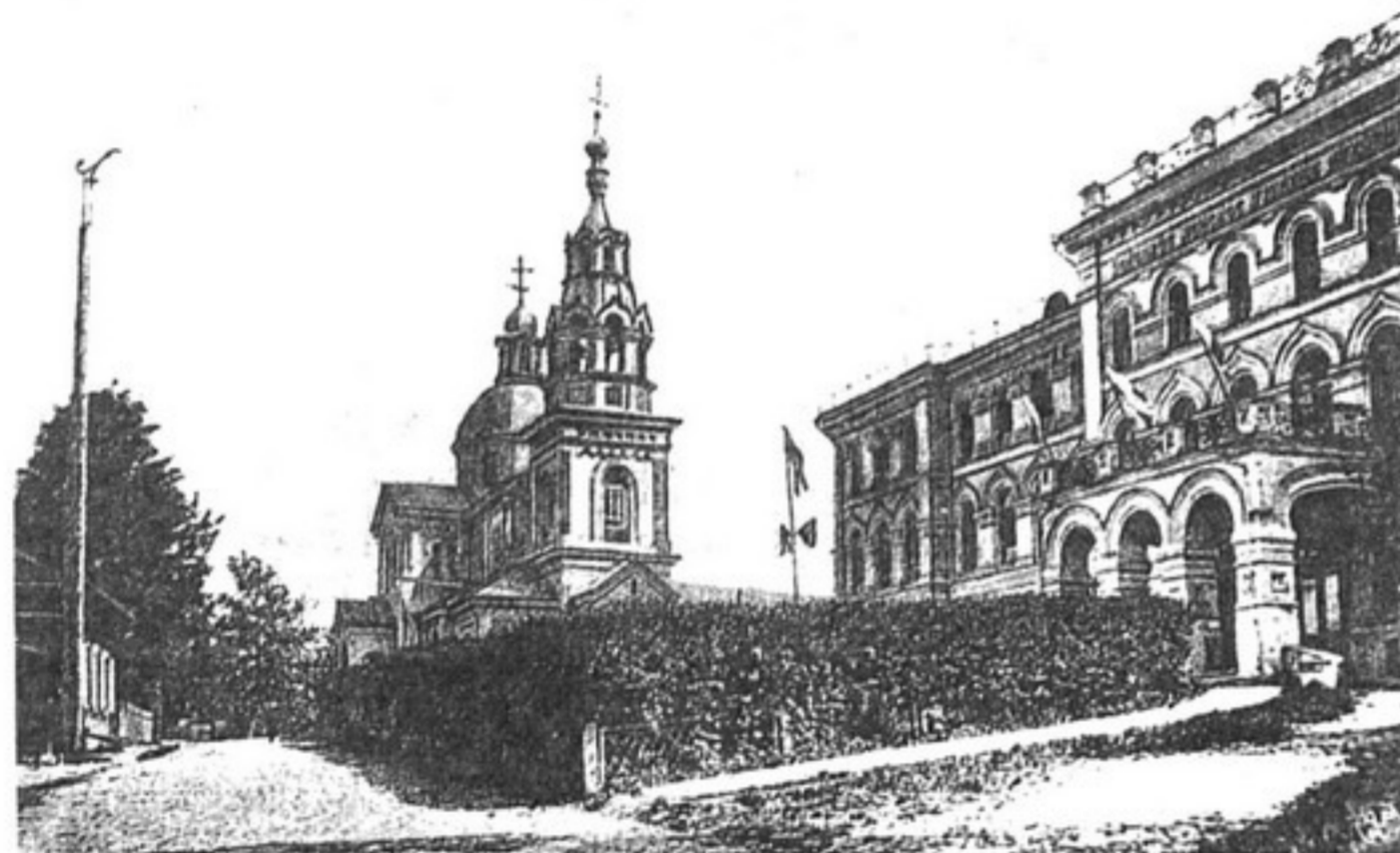
Витебск. Женское духовное училище