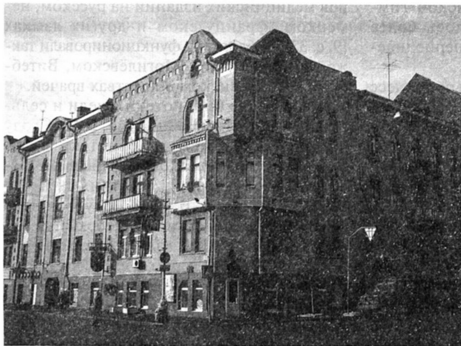
Управление Либаво-Роменской железной дороги в Минске

Новый революционный подъём вновь активизировал деятельность библиотек партийных организаций и объединений. Так, в Могилёве пропагандистской группой была создана библиотека, насчитывавшая