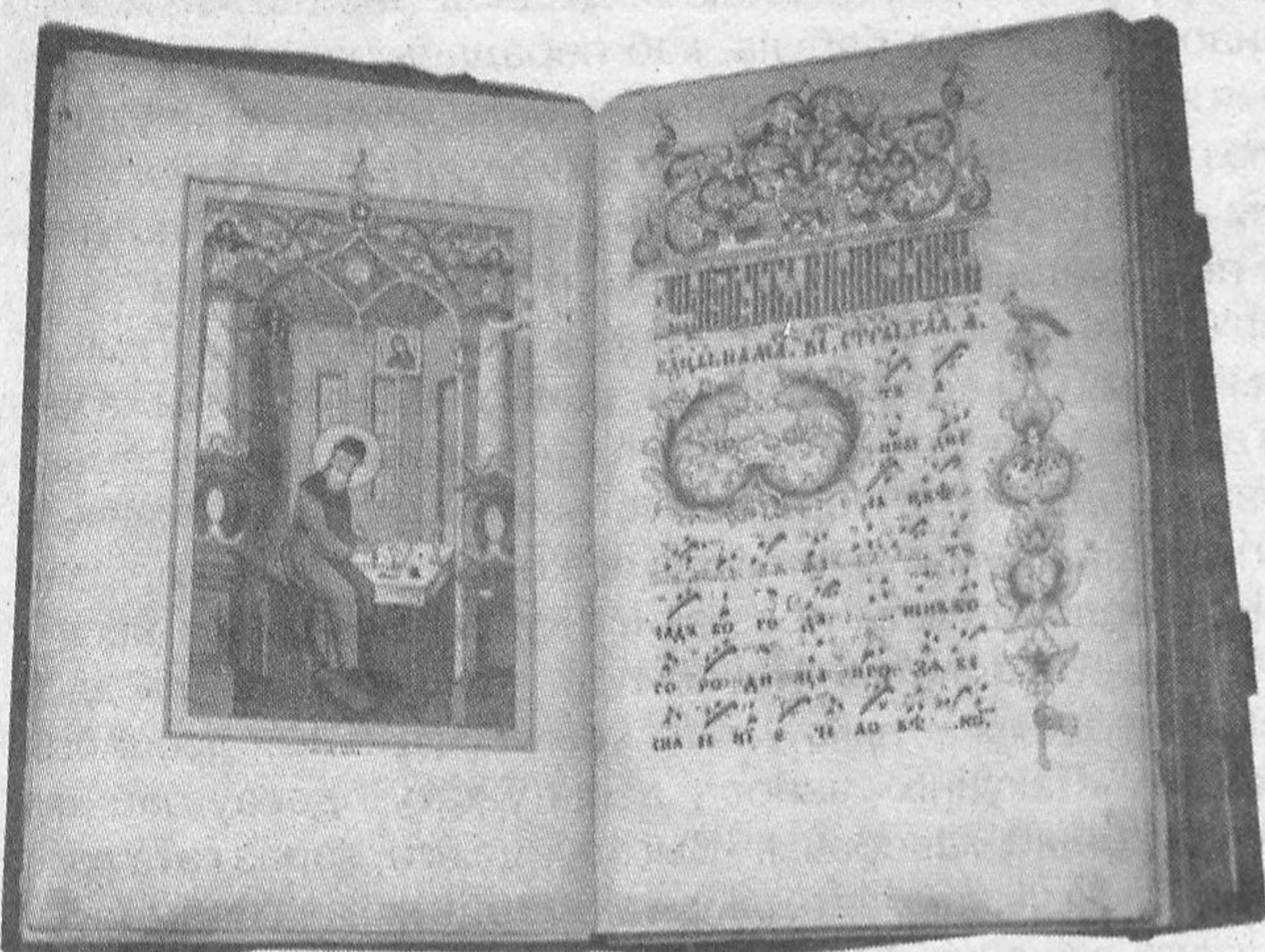
Стараверская рукапісная кніга.