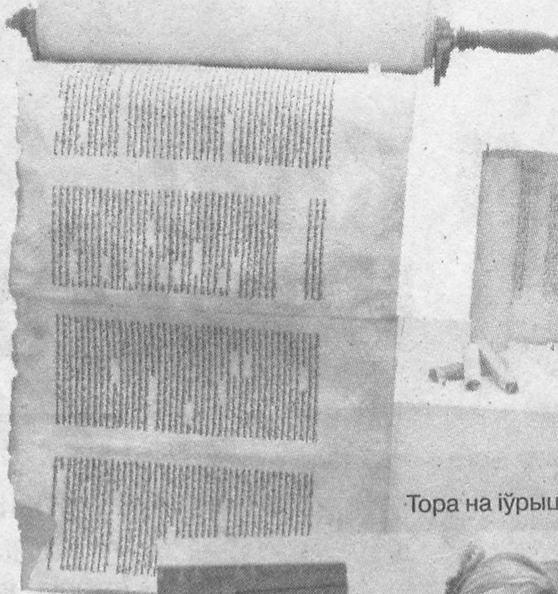
Тора на іўрыце. XIX ст.