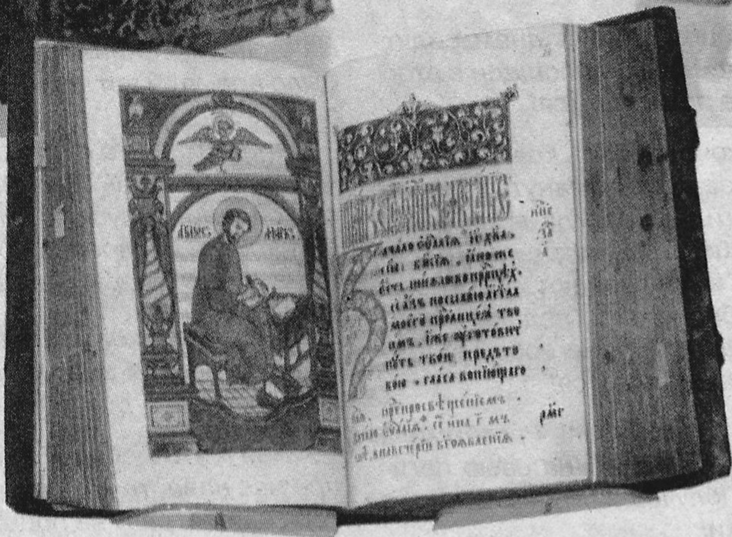
Евангелле. XIX ст.