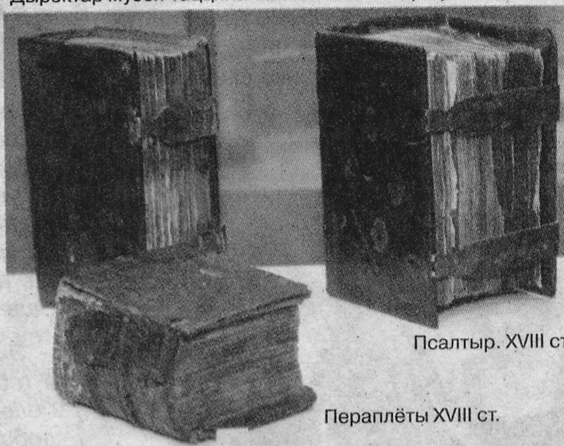
Псалтыр. XVIII ст.