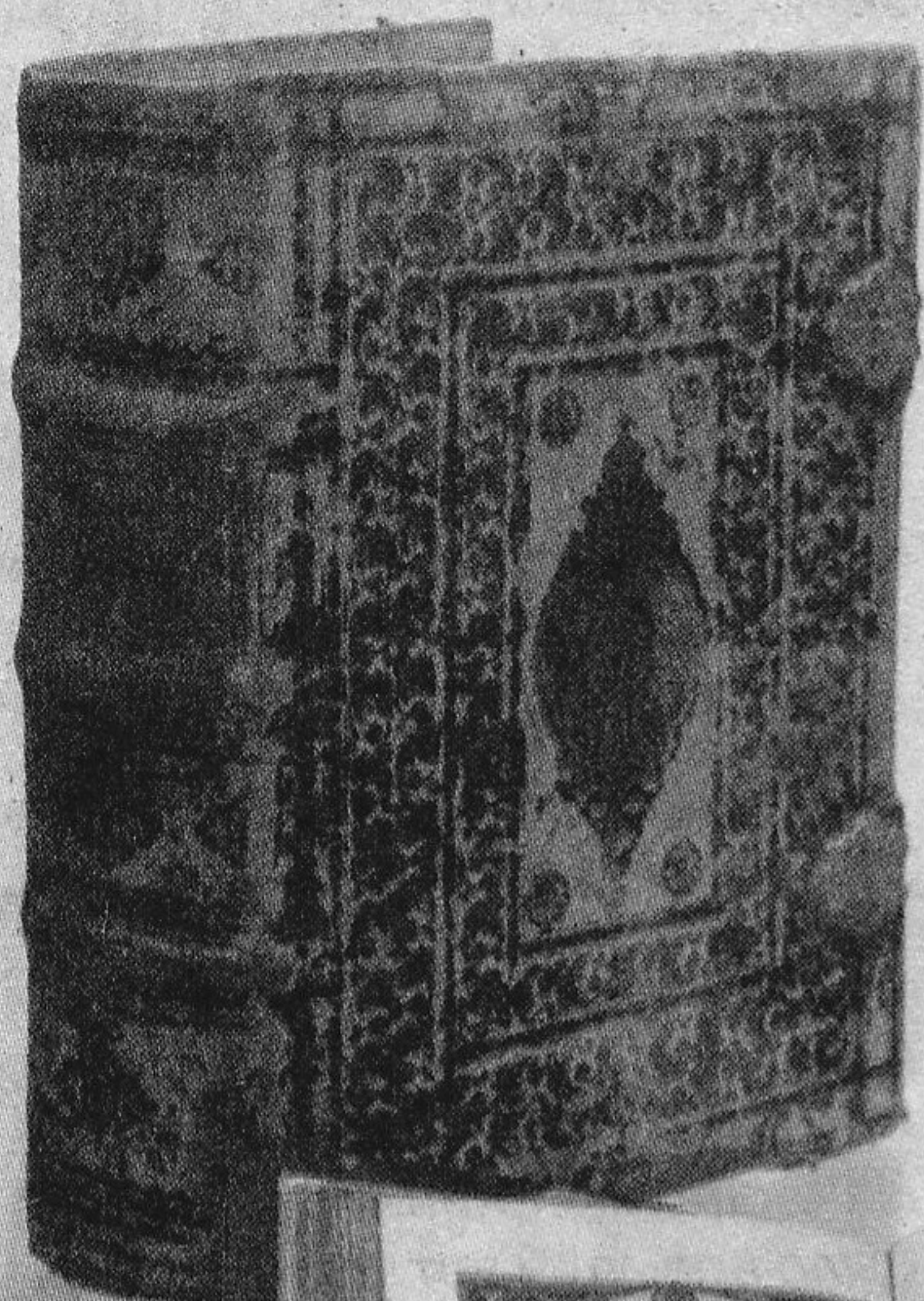
Псалтыр. XIX ст.