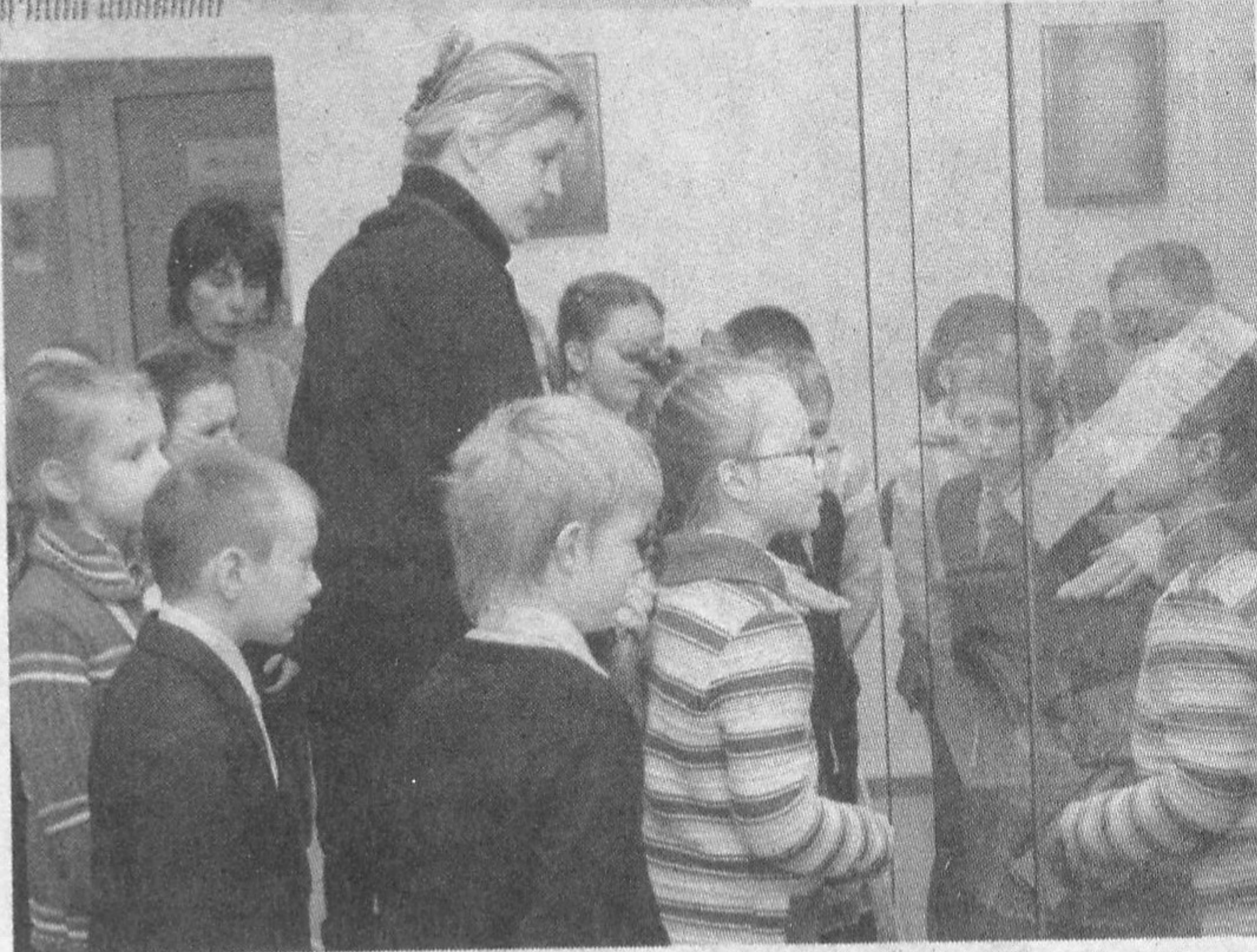
Экскурсія ў Музеі кнігі.

вялікім зборам у нашай краіне. Яна налічвае 43 выданні (45 экзэмпляраў), ахоплівае перыяд ад 1470 да 1497 года і ўяўляе значную культурную і гістарычную каштоўнасць. У музеі можна пабачыць старадрукі XV стагоддзя, якіх няма ў іншых музейных і бібліятэчных калекцыях Беларусі.