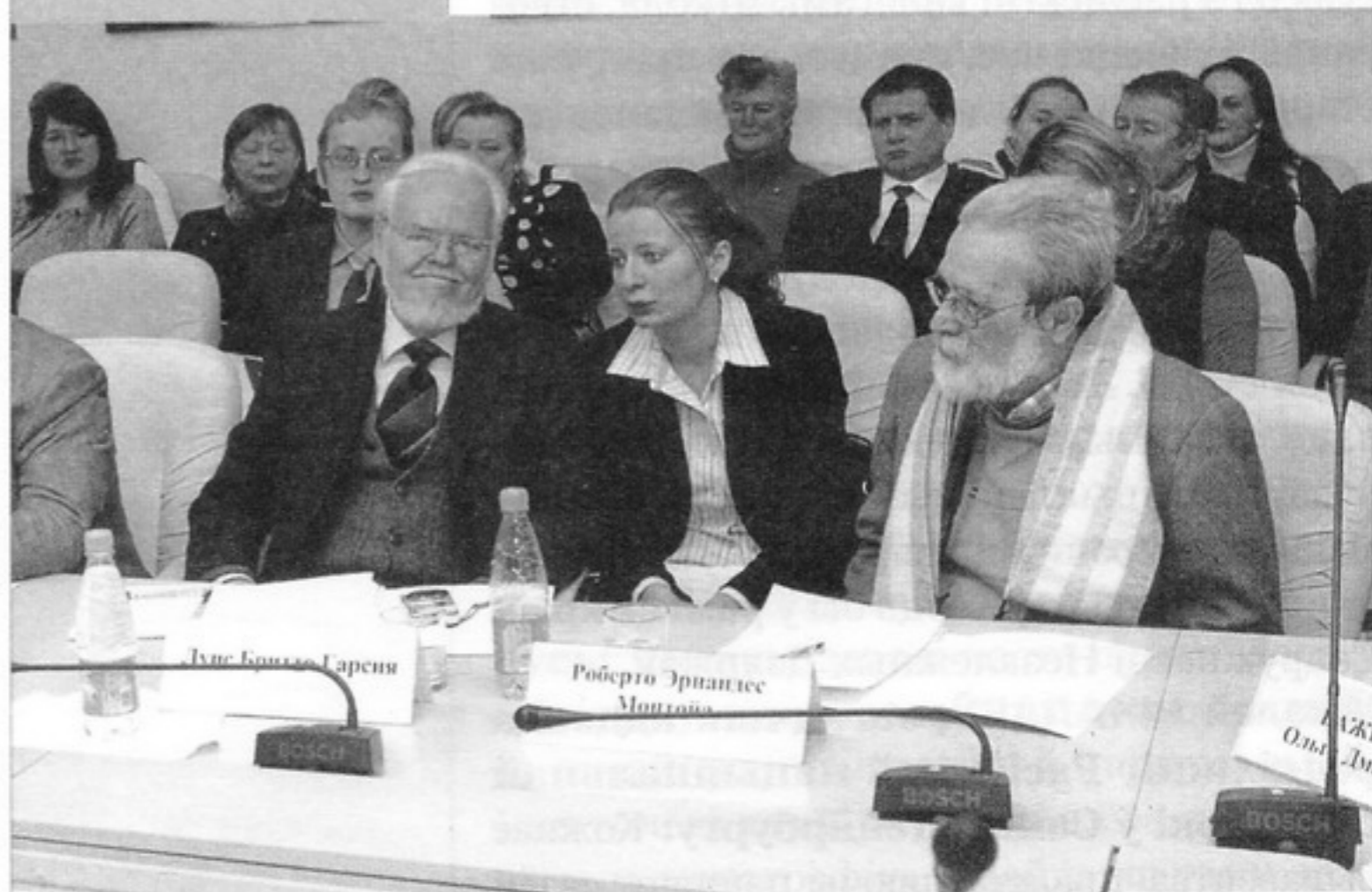
Госці з Венесуэлы

Аляксандр ЛАКОТКА, дырэктар Інстытута мастацтвазнаўства, этнаграфіі і фальклору імя Кандрата Крапівы Нацыянальнай акадэміі навук Рэспублікі Беларусь: Наш інстытут таксама мае даўнія традыцыі супрацоўніцтва з «Беларускай энцыклапедыяй». Нашы сумесныя праекты – «Энцыклапедыя літаратуры і мастацтва Беларусі», «Этнаграфія Беларусі», «Архітэктура Беларусі», «Беларуская фаль-