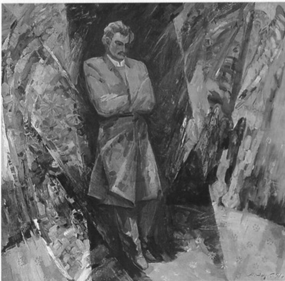
Мікалай Апіёк. «І думкі мкнуцца». Максім Багдановіч на выставе случкіх паясоў у Вільні. Алей. 2001.

Выявы Багдановіча з маці і бацькам з'явіліся яшчэ на першых юбілейных выстаўках. Адзін з такіх твораў — з пасылам да манументалізацыі вобразаў і моцным імпульсам рамантызацыі герояў палатна — групавы жывапісны партрэт «Марыя Апанасаўна Багдановіч з сынам Максімам» (1980), створаны Віктарам Маркаўцом. Лірычнасцю вылучалася жывапісная кампазіцыя Алеся Ксяндзова «Увечары. Сямейны партрэт» (1981). Спробу надаць вобразам маці і сына антычную велічнасць здзейсніў Рыгор Таболіч у творы «Маці паэта» (1981). Пачуццём усхваляванага стаўлення да герояў карціны пазначаны «Сямейны партрэт» (1981) Уладзіміра Кожуха, які экспанавалася і ў 2011 годзе на праведзенай паралельна выстаўцы «Вянок Максіму» (галерэйна-выставачны комплекс Нацыянальнай бібліятэкі Беларусі). Названыя палотны ўтваралі своеасаблівы выхад у атмасферу, гістарычную сітуацыю, у якой узрастаў будучы класік прыгожага пісьменства. Творчы патэнцыял аўтараў карцін, іх адказнасць у справе ўвасаблення тэмы і проста захапленне яскравай постаццю і значнай старонкай гісторыі беларускай літаратуры не дапускалі магчымасці схібіць, быць недакладнымі ў фактах. Не