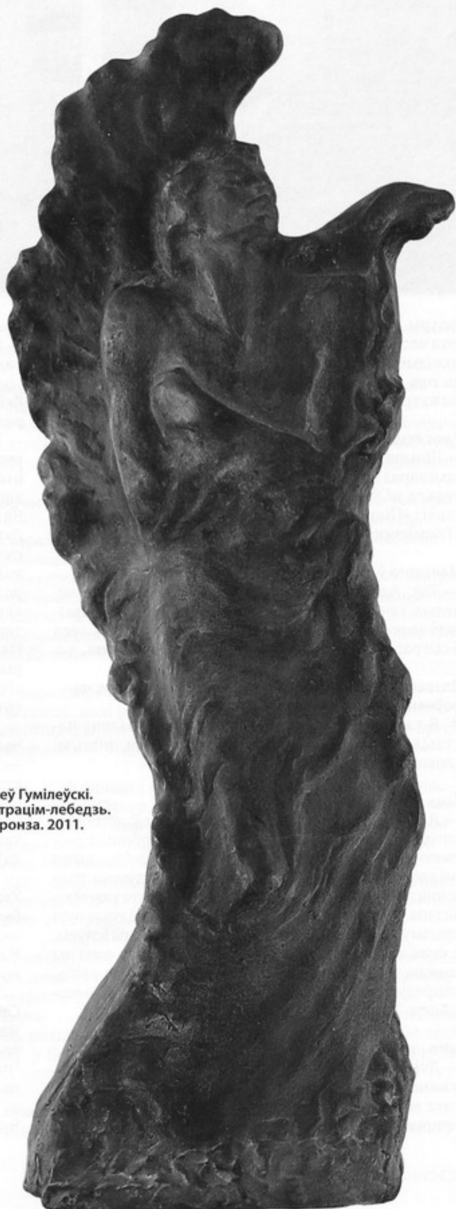
Леў Гумілеўскі. Страцім-лебедзь. Бронза. 2011.

Ідэя прэзентацыі ў нацыянальна і гістарычна значнай экспазіцыі твора выбітнага мастака, чые здабыткі і жыццёвы шлях заслугоўваюць глыбокай павагі, не арыгінальная, і такое рашэнне часта аказваецца слушным. «Крэва» на першы погляд нібыта і не датычылася тэмы выставы, але гэтак палатно мае ўнутраную повязь з напалам грамадзянскага гучання ў творчасці паэта: Крэва для беларусаў — наймагут-