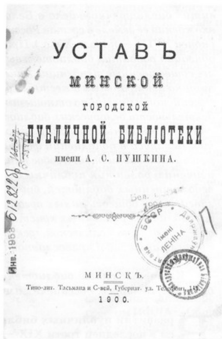
Титульный лист Устава Минской городской публичной библиотеки

Первая же «общая приятельская библиотека» была организована витебской молодежью еще в 1840-х гг., но из-за финансовых трудностей она просуществовала всего шесть лет [26, с. 157]. Идея создания общественных публичных библиотек получила более широкое распространение в начале 1860-х годов. В это время открылась общественная библиотека в Новогрудке, молодежная библиотека в Опшмянах и других городах. В них преобладали польские и французские издания, приобреталась прогрессивная для того времени литература [5, с. 59]. После подавления восстания 1863—1864 гг. ряд общественных библиотек был закрыт, включая и Новогрудскую общественную библиотеку [2, с. 26]. Однако под влиянием общественности царские власти вынуждены были в конце 1860-х гг. пойти на предоставление некоторых демократических свобод, в том числе открытие публичных библиотек. Тем не менее за период с 1863 по 1880 г. в Беларуси было разрешено открыть только три библиотеки: в Минске, Витебске и Пинске [39, с. 31]. Чтобы не допустить распространения через библиотеки демократических идей, царское самодержавие