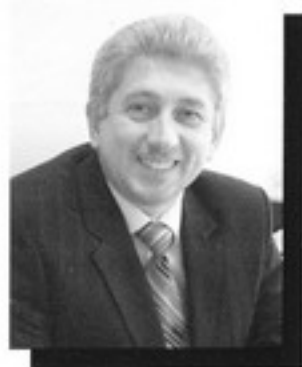
Роман Степанович Мотульский, директор Национальной библиотеки Беларуси, президент НП «Библиотечная Ассамблея Евразии», доктор педагогических наук, профессор

Во второй половине XIX в. в Беларуси появились предпосылки для более интенсивного увеличения числа библиотек в городах и создания их в сельской местности. Это было вызвано подъемом уровня социально-экономической и культурной жизни, обусловленным развитием промышленности. Вместе с тем проведение реформ, в том числе в области просвещения, в Беларуси совпало с реакцией царизма, наступившей после подавления восстания 1863—1864 годов. Это привело к закрытию ряда библиотек, замедлению темпов развития существующих библиотек и открытия новых. На основании циркуляра от 28 марта 1864 г. в Северо-Западном крае были закрыты библиотеки, основу фондов которых составляли польские книги, а также те, где польская литература составляла только часть фонда. Некоторые библиотеки перестали существовать из-за участия их сотрудников и попечителей в политических выступлениях [20, с. 32]. За поддержку восставших были закрыты