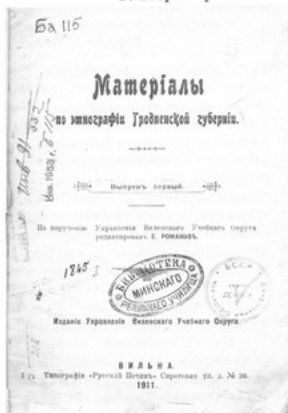
Титульный лист книги из библиотеки Минского реального училища

В то же время менялось положение и роль библиотек учебных заведений, действовавших на территории края. Борясь с польским и католическим влиянием, царизм начал еще активнее проводить русификаторскую политику. В марте 1864 г. за восстание, поднятое студентами и преподавателями, было закрыто единственное на территории современной Беларуси высшее учебное заведение — Горы-Горетский земледельческий институт, перестала функционировать и его библиотека. В том же году власти закрыли