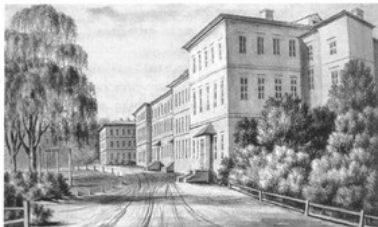
Горы-Горецкий земледельческий институт.

В период подготовки и проведения революции 1905—1907 гг. царское правительство вынуждено