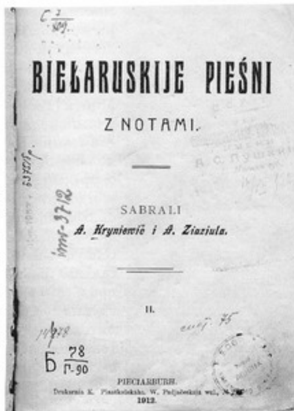
Титульный лист книги из собраний Минской городской общественной библиотеки им. А.С. Пушкина

Развитие и активизация в крае в конце XIX — начале XX в. социал-демократического и национально-освободительного движений привели к возникновению в Беларуси легальных и