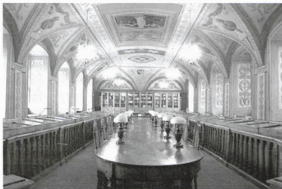
Зал Франциска Смуглевича в Библиотеке Виленского университета

Наиболее ощутимый урон был нанесен высшему образованию в результате закрытия единственного в то время высшего учебного заведения в Беларуси и Литве — Виленского университета . К 1830-м гг. он стал не только центром просвещения и культуры Литвы и Беларуси, но и центром свободомыслия и распространения демократических идей. Массовое участие преподавателей и студентов университета в восстании 1830—1831 гг. послужило причиной для его закрытия царскими властями в 1832 году. На его базе были созданы Медико-хирургическая и Духовная академии. Библиотека университета оказалась раздроблена: ее фонд поделили между академиями, а часть литературы направили в Белорусский учебный округ. В 1842 г. Медико-хирургическая академия вместе с библиотекой была передана Киевскому университету, а Духовная академия переведена в Петербург [7, с. 97—98, 105, 111,