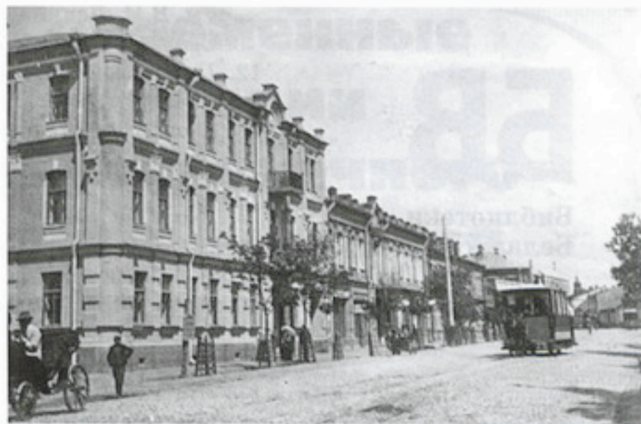
Могилевская публичная библиотека (здание Дворянского собрания)