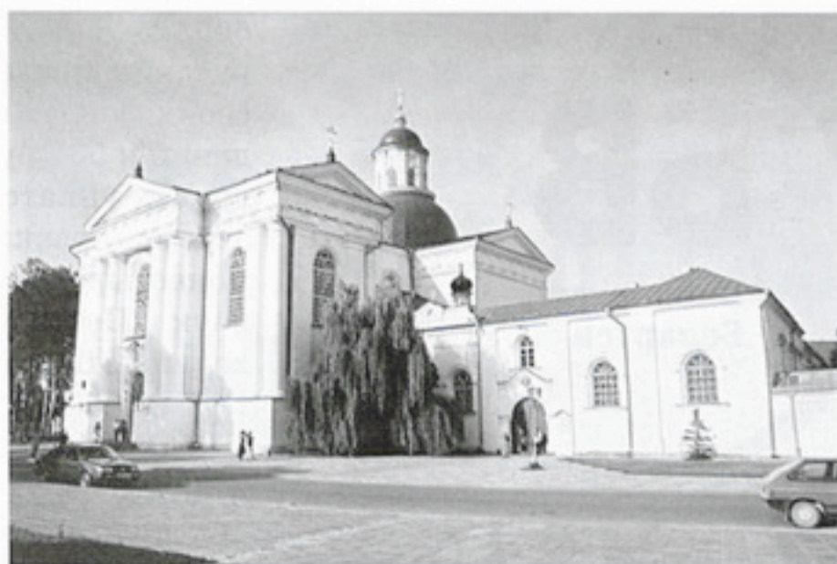
Постройки Жировичского монастыря

Политика, проводимая правительством Российской империи на белорусских землях, отразилась в первую очередь на деятельности библиотек христианских конфессий. Подавив восстание, царское правительство предприняло ряд мер, направленных на усиление идеологического влияния на жителей белорусских земель, которые в большинстве своем находились под крылом не Русской православной церкви, а римско- и грекокатолической церквей. Полоцкий церковный собор Русской православной церкви в 1839 г. принял решение об упразднении грекокатолической церкви. Вместе с соборами, монастырями, учебными заведениями и типографиями закрылись и библиотеки. Благодаря ряду реформ, в том числе в сфере просвещения, было ограничено влияние на общество католической церкви и ее орденов. В результате распространения светского образования,