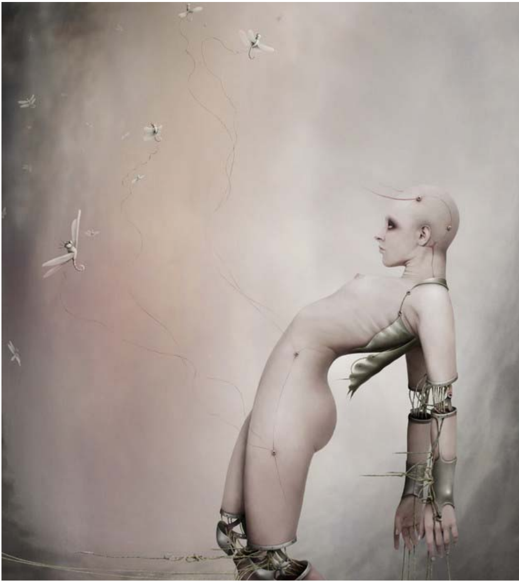
Главный куратор проекта – Федор Ястреб.