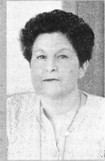
Галоўны бібліёграф Нацыянальнай бібліятэкі Беларусі